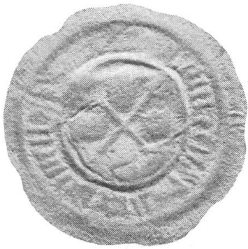
Fig. 66. Sceau du vidomnat de Genève 1499

La croix de Savoie était chargée des deux clefs épiscopales d'or et occupait au point de vue héraldique la seconde place dans l'écu.