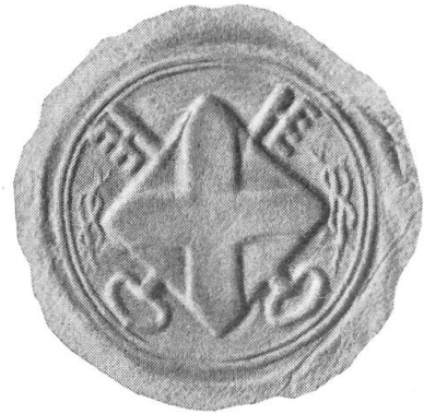
Fig. 68. Sceau d'Aymé, Conseil vidomne de Genève, 1517

Cette disposition des pièces dut, sans doute, froisser l'orgueil de Charles III de Savoie: ses visées sur Genève devenaient de plus en plus fortes et en 1519 il fit placer une croix blanche sur la porte du pont de l'Île. Un citoyen en 1527 abattit la pierre qui portait les armoiries. Le duc échoua dans ses tentatives de soumettre Genève. Est-ce sur son ordre, avec les mêmes idées de domination, que le sceau du vidomnat fut modifié?