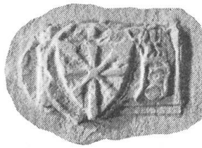
Fig. 67. Sceau du vidomnat de Genève 1402