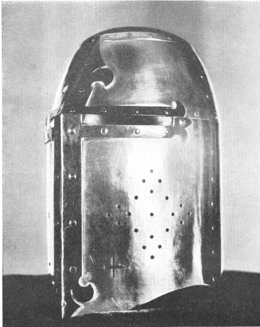
Fig. 70. La coupe du jubilé en forme de casque du XIIIe siècle

A l'occasion du cinquantenaire de la Société, quelques membres de celle-ci, inspirés par le président, eurent l'idée de la doter d'une œuvre d'art de caractère héraldique.