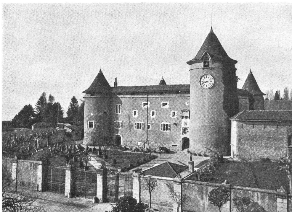
Fig. 102. Le château de Morges construit vers 1290 par le comte Louis de Savoie

pris avec beaucoup de goût par le studieux professeur de Payerne, qui consacre ses loisirs à rechercher les monuments héraldiques du Canton de Vaud. Fresques, pierres sculptées, drapeaux, suscitèrent beaucoup d'intérêt de la part des Confédérés, cependant que s'exaltait l'amour-propre des Vaudois au fur et à mesure que progressait cette promenade, qui révélait (même à nombre d'entre eux) des richesses insoupçonnées. M. le Dr von Fels lut ensuite un travail, très heureusement agrémenté lui aussi de clichés, sur les circonstances dans lesquelles se constituèrent en 1803 les armes du Canton de St-Gall. Finalement, M. Galbreath donna la mesure de ses talents de chercheur en nous éclairant sur la raison d'être d'un vitrail armorié d'une église de Maurienne et d'une famille vaudoise dont l'explication était demeurée obscure jusqu'ici.