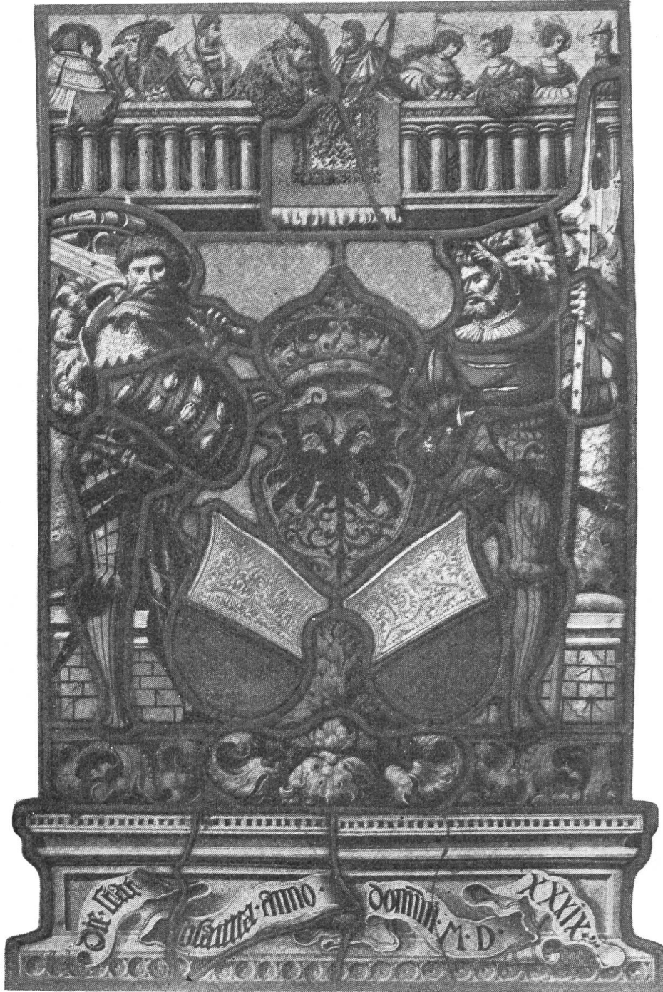
Fig. 100. Vitrail aux armoiries de la ville de Lausanne, de 1539, attribué à Hans Funk (Musée de Berne) 1)

Les Romands éprouvent généralement quelque gêne à organiser dans une de leurs villes une Assemblée générale de notre Société, car il est manifeste qu'ils ne peuvent alors s'enorgueillir des ressources héraldiques des cités d'Outre-Sarine et surtout de la possi-