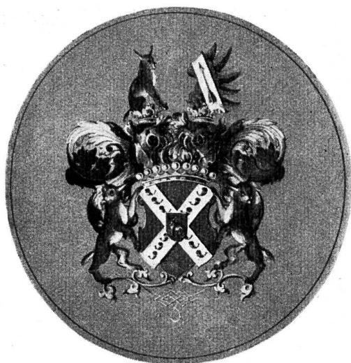
Fig. 12. Wappen aus der Copie des Grafendiploms Girtanner v. Luxburg, 1790.

Literatur : HBLS ; Bürgerbuch St. Gallen 1940 ; Næf, Burgenwerk.