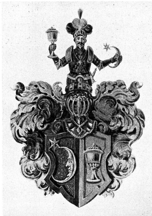
Fig. 13. Wappen aus der Copie des Familienvertrages Näf, 1830.