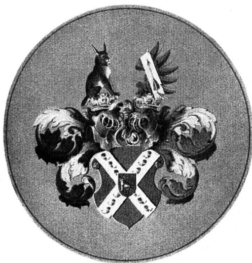
Fig. 10. Wappen aus der Copie des Adelsbriefes Girtanner v. Luxburg, 1776.

Die 3 Adelsdiplome, die wir in der Folge beschreiben, gehören sämtlich einer nach Deutschland ausgewanderten Linie an.