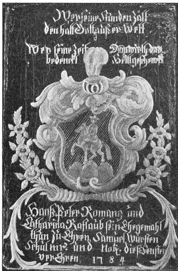
Fig. 88. Schliffscheibe Romang.