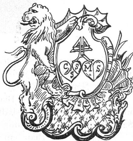
Fig. 91. Schmulzi.

Wappen : In Blau über einem grünen See ein nach rechts fahrendes Segelboot mit einem schwarzbekleideten Fährmann (Siegel 1822).