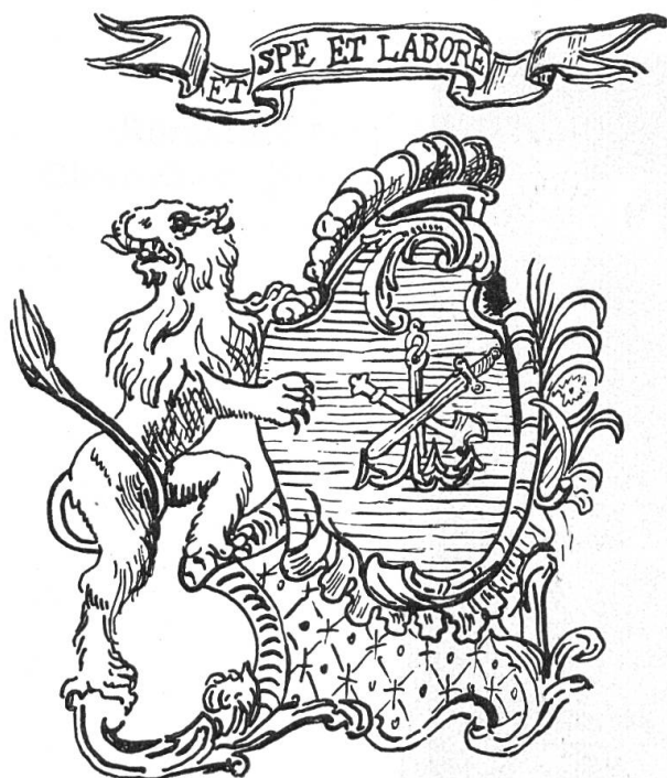
Fig. 90. Russi.