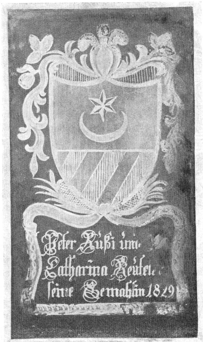
Fig. 89. Schliffscheibe Russi.

Wappen : In Weiss ein roter Löwe (Gatschets Wappenbuch 1799, Schiffscheibe Balth. Rufj 1796, Privatbesitz Bern).