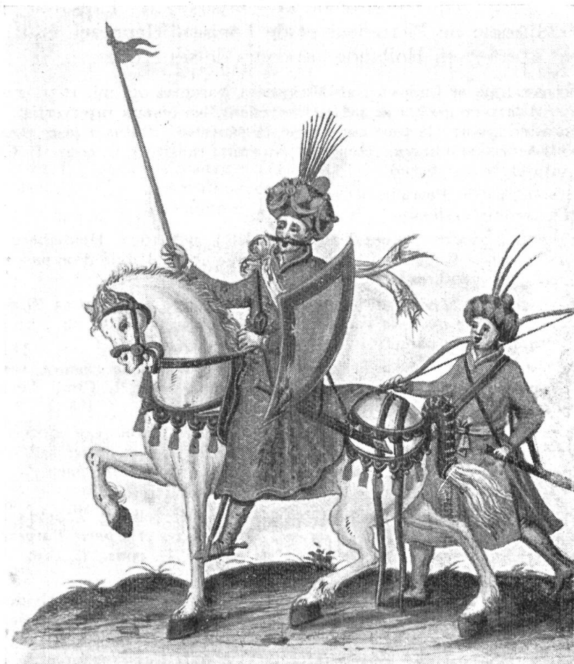
Fig. 99. Gratien Delavallée, 1623. Fo. 107. Liber Amicorum d'André Joffrey.