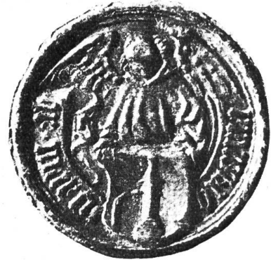
Fig. 26. Siegel des Marx Brunnemann, Konventuals von St. Gallen und Statthalters zu Wil, 2.VII. 1519.