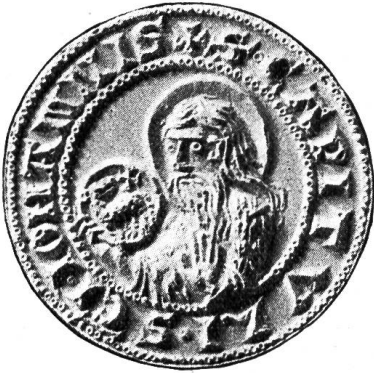
Fig. 24. Kapitelsiegel von St. Johann.