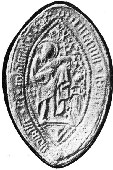
Fig. 25. Abtsiegel von St. Johann, 1515.