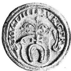
Fig. 27. Siegel des Joachim Zürcher, 1546.

Jakob Zürcher, der schon vorher Verwalter (Schaffner) des verwahrlosten Klosters gewesen war, wurde im September 1538 unter geradezu dramatischen Umständen Abt des Klosters St. Johann 3) , dessen Verfall auch er nicht aufhalten konnte. Er starb zwischen dem 8. und 10. April 1543.