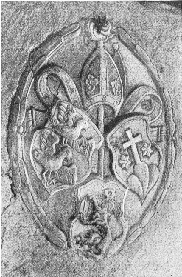
Fig. 37. Wappenrelief in Sarmenstorf.

Im Pfarrhof zu Sarmenstorf fristet eine in der Westwand des Holzschopfes eingelassene und durch einen mit Gartengeräten behangenen Holzbalken teilweise verdeckte heraldische Steinskulptur, deren ursprünglicher Standort bis anhin unbekannt war, ein wenig beachtetes Dasein.