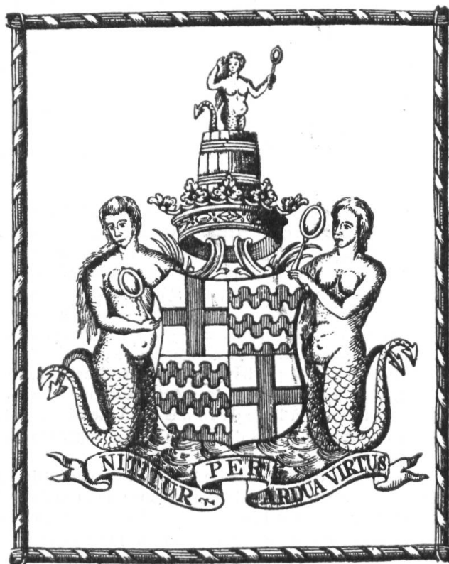
Fig. 55. Ex-libris d'A. L. de Saint-Georges, comte de Marsay.