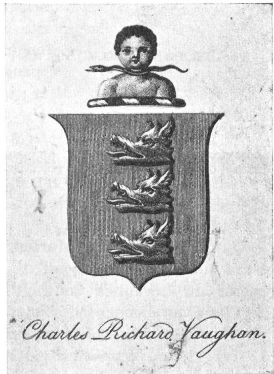
Fig. 57. Ex-libris de C. R. Vaughan.

A. : de gueules à trois hures de sanglier arrachées d'argent, posées en pal. C. : un buste de garçon, de carnation, chevelé de sable, le cou entouré d'un serpent au naturel. Ex-libris armorié (fig. 57). Réf. : B D R, 2, p. 159 et 188. — B L G (1937), p. 2325. — C B P, 30262. — D N B, 58, p. 161.