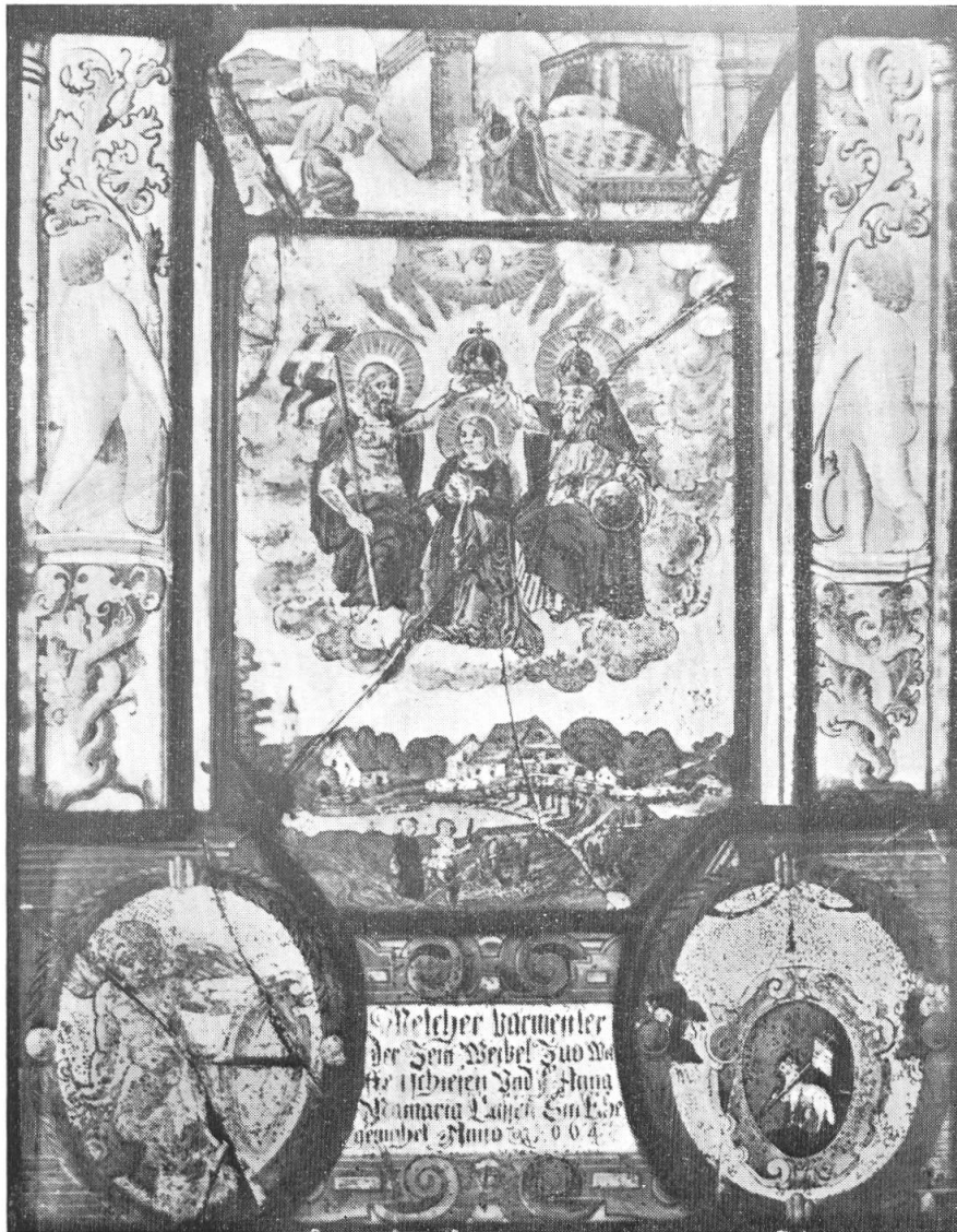
Scheibe des Melchior Barmettler, 1664.