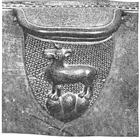
Fig. 13 und 14. Misericordien mit den Wappen Schaler und Tierstein.

und Kirchherr zu Gebwiler, 1368 Erzpriester und 1382 avignonesischer Gegenbischof als Kandidat Herzog Leopolds von Oesterreich (Fig. 13).