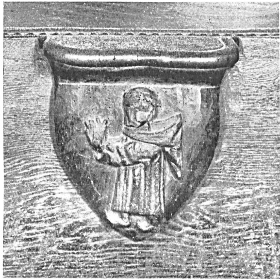
Fig. 11 und 12. Miserikordien mit den Wappen Hohenklingen und Münch.