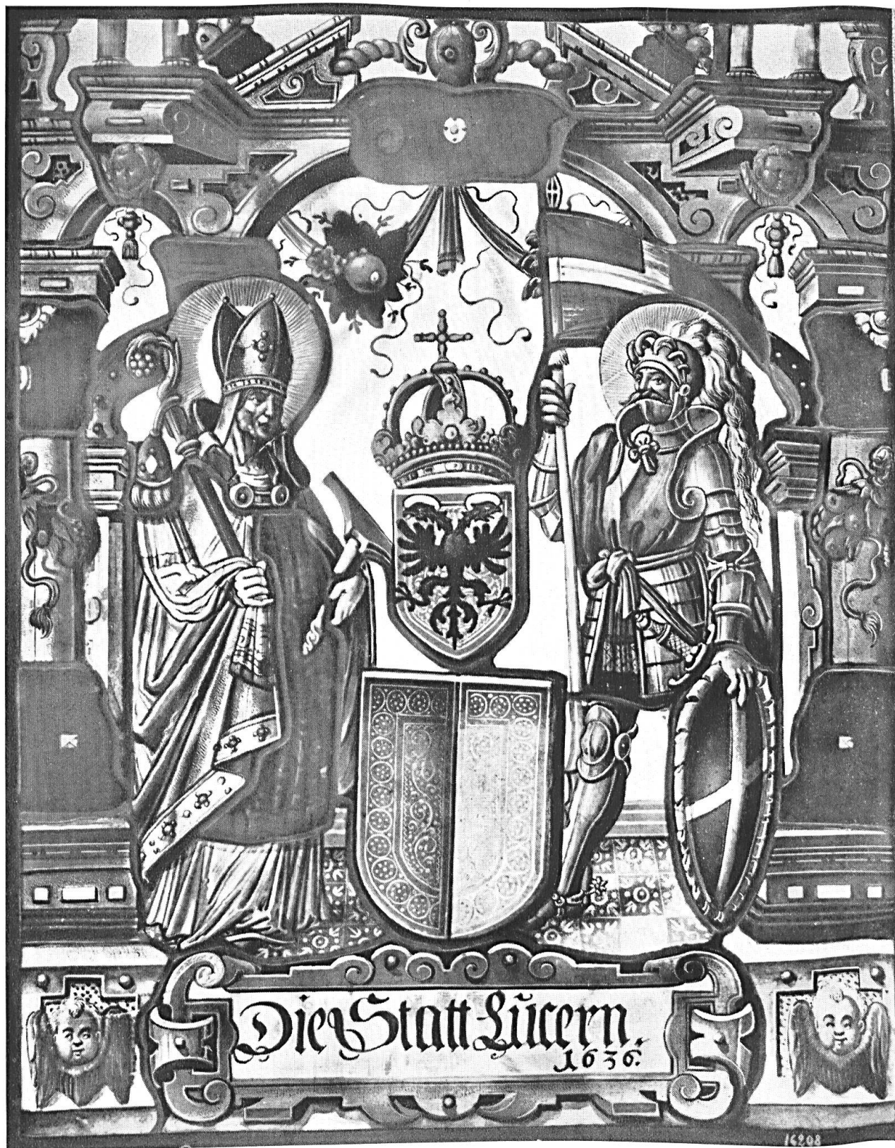
Die Stadt Luzern, 1636. Scheibe aus der Kapelle zu Haltikon.