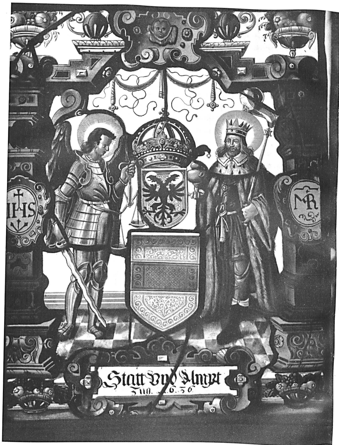
Stadt und Amt Zug, 1636. Scheibe aus der Kapelle zu Haltikon.