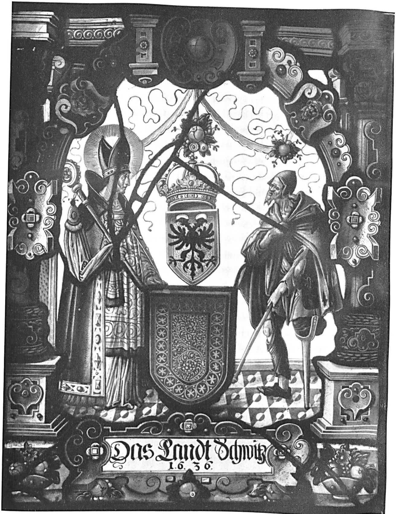
Das Land Schwyz, 1636. Scheibe aus der Kapelle zu Haltikon.