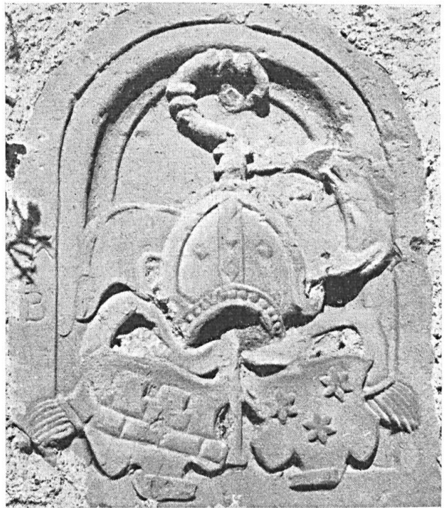
Fig. 19. Jodocus Singeisen, Abt von Muri.

Auf dieser jetzt noch 14 ha umfassenden Liegenschaft stehen neben einem stattlichen (nun mit roten Eternitplatten leider arg verschandelten) Luzerner Bauernhause eine geräumige Scheune, ein Waschhaus und eine Weintrotte, wovon letztere sowie auch die Scheune heraldischen Schmuck tragen.