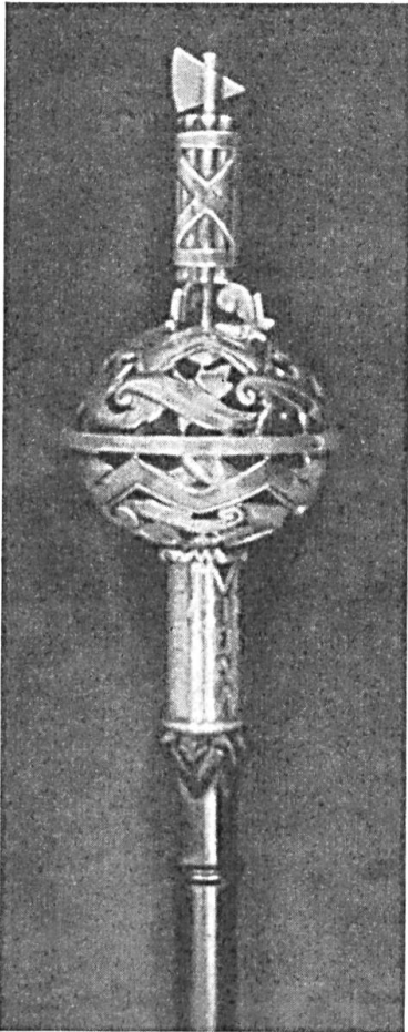
Fig. 55. Das Szepter des Kantons St. Gallen.

irgend einer Stilrichtung innerhalb der Blasonierung wahr. Unser Vorschlag, der dann auch im Gemeindegewappbuch festgelegt wurde, lautet :