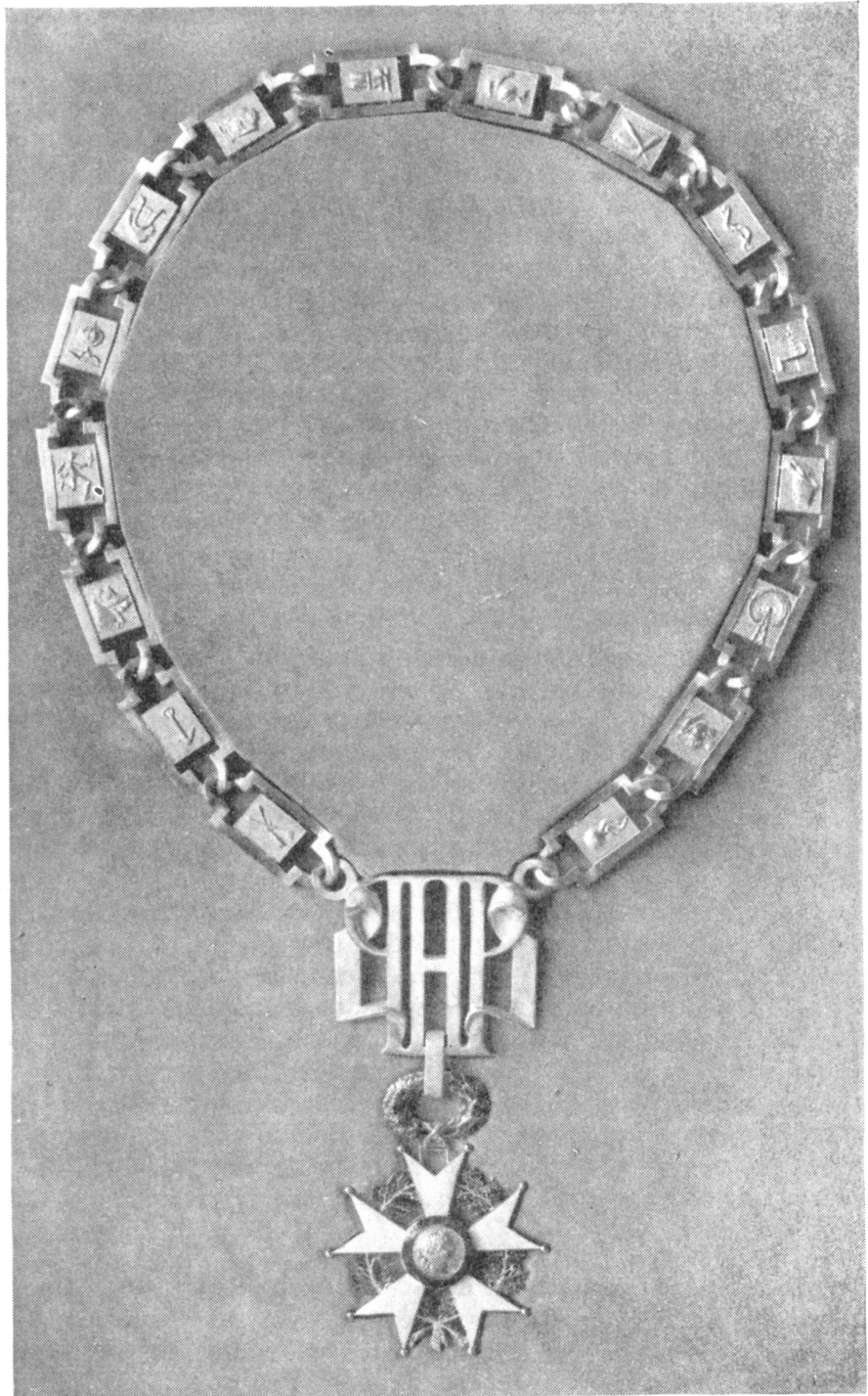
Fig. 4. Collier de la Légion d'Honneur sous la IV e République.

Le collier de la Troisième République a été exécuté par LEMOINE postérieurement au 14 juillet 1881, date à laquelle le dessin a été accepté par le Président Grévy (fig. 3). Ce collier est l'insigne du Grand Maître de l'Ordre, réservé au chef d'Etat. Le président ne porte pas le collier. Il porte les insignes de Grand' Croix, dignité dont il reste titulaire quand son mandat est terminé. Le collier est remis au nouveau président par le Grand Chancelier qui l'intronise par la formule consacrée, dans la dignité de Grand Maître de l'Ordre, mais la grande chancellerie reste gardienne de l'insigne lui-même. Le nombre des maillons est toujours semblable. Les