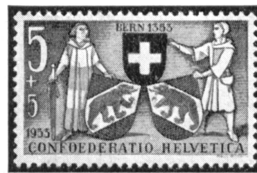
Fig. 7-9. Schweizer Wappenmarken (Zurich, Zug, Bern).

Wert von 5 Rappen als Wappenmarke herauszugeben. Für alle drei Marken hat unser Mitglied Paul Boesch je eine Gruppe von drei Wappenschilden mit zwei Schildhaltern komponiert. Die Zürcher und die Berner Marke enthalten zweimal den Kantonschild, wobei die beiden Schilde einander zugewandt sind, wogegen die Marke von 1952 je einmal den Schild von Glarus und Zug aufweist. In allen drei Marken sind die Kantonschilde überhöht vom Schweizerwappen, dessen Kreuz auf rotem Felde leuchtet, während die übrigen Teile der Marken nur grau auf