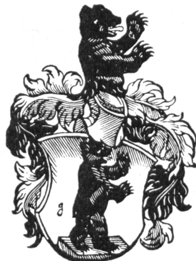
Fig. 5. Das Wappen Doppenstein.

A propos d'un curieux usage héraldique. — Les très intéressantes armoiries signalées par M. A. R. Wagner (fig. 6) 3) , posent plusieurs problèmes, notamment celui des brisures des Lusignan. On voudrait seulement répondre à la question posée à leur sujet :