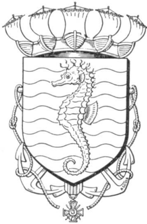
Fig. 12. Armes de Merville Franceville plage (Calvados).

une couronne aviale. C'est chose faite depuis quelque temps, et des villes de France qui possèdent, sur leur territoire, un aéroport ou une base aérienne n'ont pas hésité à timbrer leur écu de la couronne aviale (ainsi Bouguenais aéroport de Nantes).