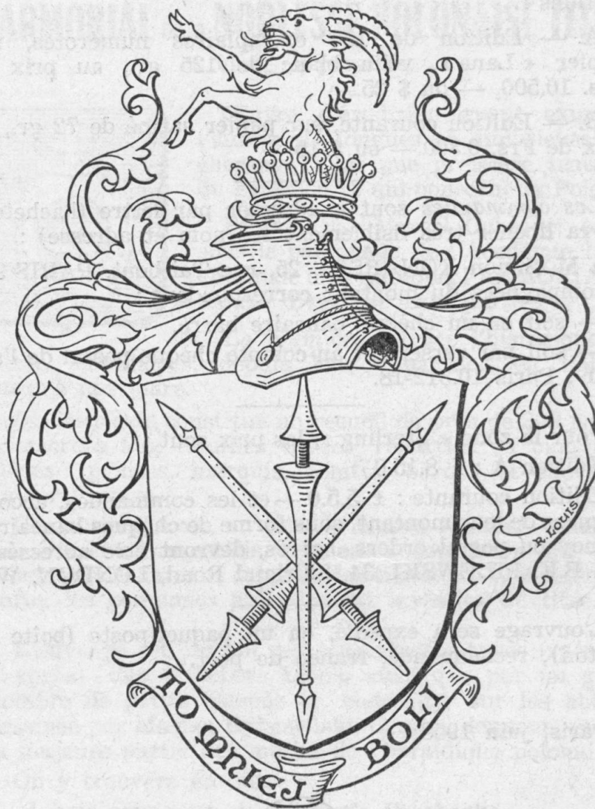
Blason des COMTES Zamoycki : (armes « Jelita »).