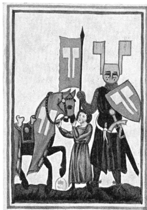
Fig. 3. Wolfram d'Eschenbach, d'après le manuscrit des Minnesänger (Heidelberg).

Les armoiries attribuées à Wolfram par le miniaturiste sont contestées par la critique moderne. S'appuyant sur celle-ci, M. Ernest Tonnelat pense « que le blason qu'on y voit figurer était celui de chevaliers qui résidaient aux environs d'Eschenbach, mais n'étaient point apparentés à la famille de Wolfram ». (Ernest Tonnelat, Introduction à la traduction française du « Parzival », Paris, 1934, p. VIII et IX).