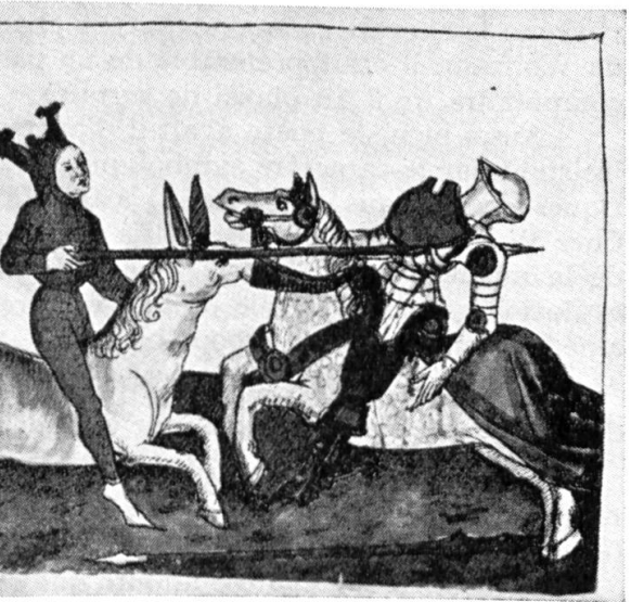
Fig. 5. Parzival vainqueur du chevalier vermeil , d'après la miniature d'un manuscrit de la Bibliothèque de Berne (Cod. AA. 91, fol. 28 v.), daté de 1467 (école allemande).

« Du molu , la racine est noire , par similitude avec l'épaisse obscurité dont s'enveloppe, à ses débuts, l'éducation des âmes qui n'aperçoivent pas encore le but à atteindre; et, au contraire, la fleur a la blancheur du lait, par ressemblance avec l'éclat et la splendeur dont la fin dernière des initiations consiste à les revêtir. »