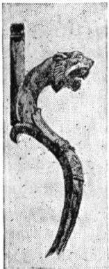
Fig. 2. La panthère bachique de Bavaï (Nord), montrant la collerette, qu'on pourrait à la rigueur prendre pour une crinière. (Musée de Douai). Fragment d'un trépied de Bacchus, en bronze.

Ce premier point établi, nous pouvons entrer dans le vif du sujet.