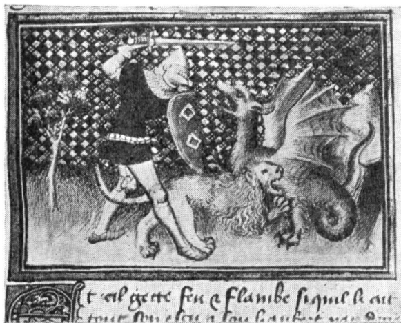
Fig. 4. Perceval prend part à la lutte du lion contre le dragon.

Sans entrer dans l'explication ésotérique, qui n'est pas de notre domaine, nous pouvons bien observer que l'apparition des Templiers pose un problème. Ils étaient amis des Angevins,