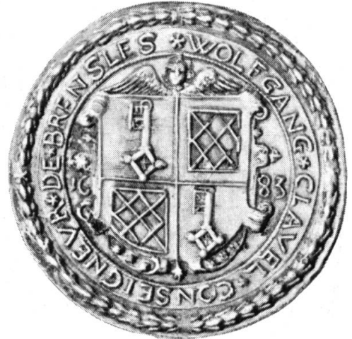
Fig. 4. Sceau Clavel-Rolaz