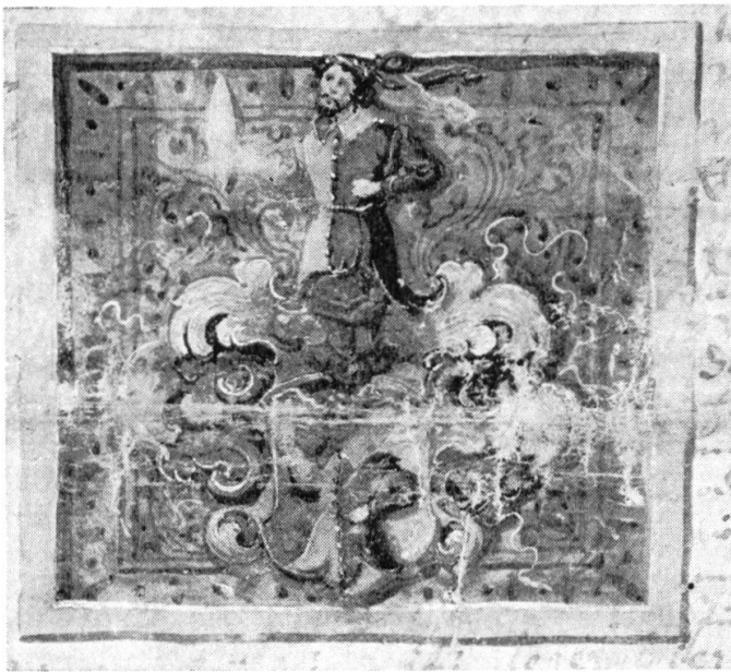
Abb. 1. Wappen Kast, 1642.