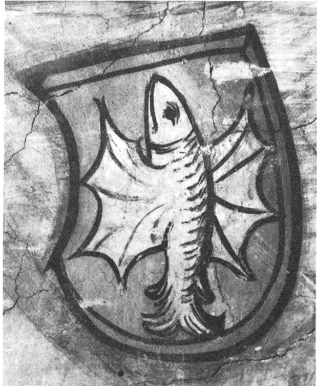
Abb. 3. Wappen von Lütishofen

gegeneinander lossprengenden Ritter glücklicherweise erhalten. Die beiden Ritter werden von vier, hinter und zwischen den Pferden springenden Knappen begleitet. Am Boden liegen zwei geborstene Stechlanzen (Abb. 1). Heraldisch interessant sind die Schilde der Ritter, mit welchen die Pferddecken bemalt sind. Heraldisch rechts achtmal das Wappen der Schürpf von Luzern, in g. ein schrägrechts gestellter, schw. Feuerspan (Abb. 2) und links siebenmal der Schild der Lütishofen, in r. ein fliegender w. Fisch (Abb. 3). Dank dieser erhaltenen Wappendokumente können die das Turnier austragenden Ritter wie auch die Entstehungszeit des Wandgemäldes bestimmt werden. In Betracht kommen: Kleinrat Hans Schürpf (1) von Luzern, der sich um 1468 mit Barbara von Lütishofen verhelichte und ein Herr von Lütishofen, vermutlich der Bruder der genannten Barbara (2). Die beiden Familien gerieten 1483 anlässlich der Teilung der Lütishofer Verlassenschaft in einen Erbstreit, welcher nicht nur die beiden