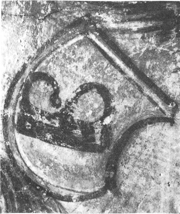
Abb. 2. Wappen Schürpf