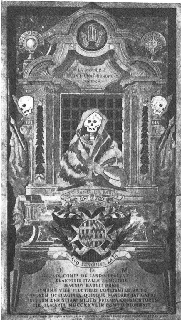
Fig. 6. Tombe du commandeur de Lando

( Requiescat in Domino ). Au-dessus du sarcophage se dresse un mur percé d'une fenêtre ronde à travers laquelle on aperçoit la mer et des rochers.