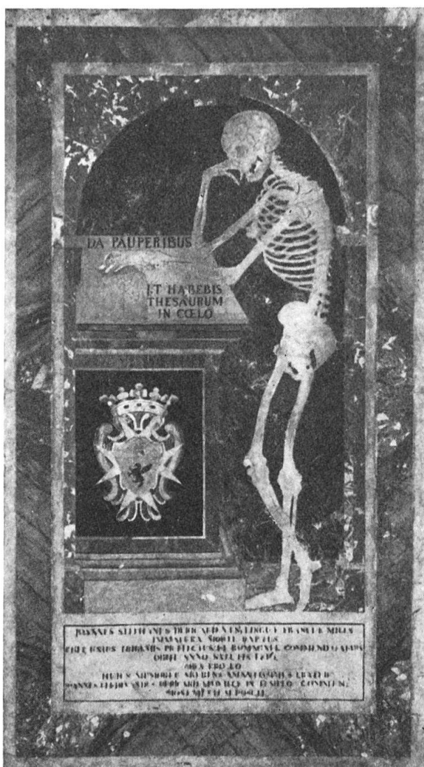
Fig. 2. Tombe du bailli de Ricard