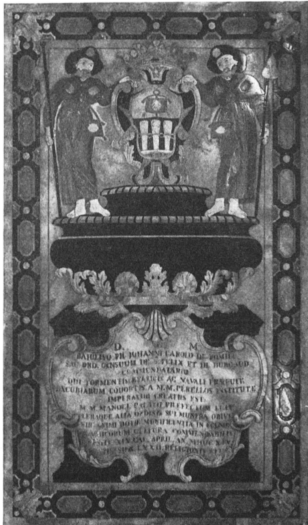
Fig. 5. Tombe du chevalier de Romieu

porte le cercueil du chevalier Grognet (1714). Des squelettes voilés hantent les tombes du chevalier Magalhães (1711), du comte de Lando (fig. 6), (1726), d'Arrigi (1750). Un squelette gît dans sa tombe sur la dalle du commandeur Silvestri (1714). Un autre symbole est la pendule, qui marque l'irréparable fuite du temps. Un squelette chevauche une horloge sur la dalle de Figuera (1720) ; le commandeur de Cespédès (1650) a une Renommée au-dessus de la sienne. La fuite du Temps est une autre hantise retracée sur ces étonnantes pierres tombales. Sur la tombe du commandeur Pinto Coutinho (fig. 1), mort en 1736, le Temps ouvre un tombeau, et trouve le blason du chevalier ainsi qu'une inscription : « Req. in Do. »