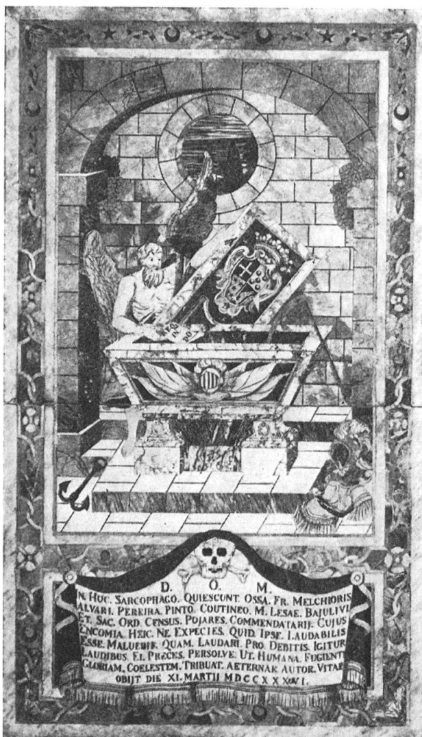
Fig. 1. Tombe du commandeur Pinto Coutinho

térêt, pour l'histoire du blason, ainsi que pour l'histoire tout court. Il est relativement facile de se faire une idée de ces dalles : elles ont toutes été reproduites dans l'admirable ouvrage de Sir HANNIBAL SCICLUNA, The Church of St John in Valetta , publié à Rome en 1956. Il est impossible