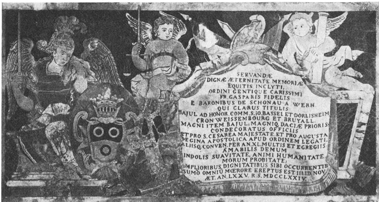
Fig. 7. Tombe du commandeur de Schönau

Il y a des raretés parmi des dalles. Sur la tombe du bailli de Fleurigny est représenté le combat naval qu'il a gagné sur les Turcs. C'est la reproduction d'une des petites gouaches qui illustraient les exploits des marins de l'Ordre, exécutée avec une grande minutie. Les tenants sont deux images d'esclaves turcs. Sur la tombe du chevalier Lopez (fig. 4), obscur Espagnol mort en 1795, la Renommée, coiffée du casque du porte-étendard de l'Ordre, pleure sur une urne. Et cette urne est un vase grec rouge à figures noires, grandeur nature. Or, ces vases grecs n'avaient attiré l'attention des érudits et des collectionneurs que depuis peu de temps : l'un des premiers spécialistes avait été William Hamilton (plus tard, Sir William Hamilton), ministre d'Angleterre à Naples. C'était seulement aux alentours de 1780, avec le renouveau de l'intérêt porté à la Grèce, que l'on avait commencé à étudier les vases trouvés en Campanie. Les chevaliers de Malte en général, et Lopez en