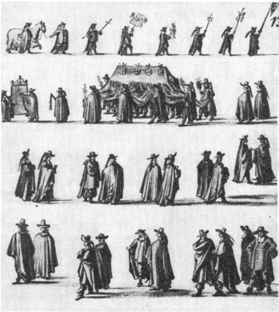
Fig. 1. Funérailles de Thierry van Arnhem