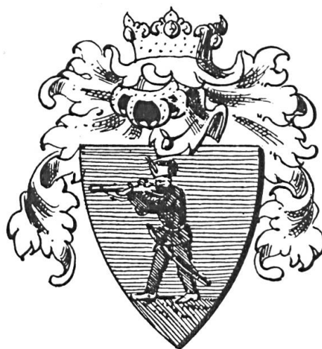
Fig. 3. Lakatos de Füzes, 1659

Le contexte humain de ces meubles héraldiques, nés avec et inspirés de l'évo-