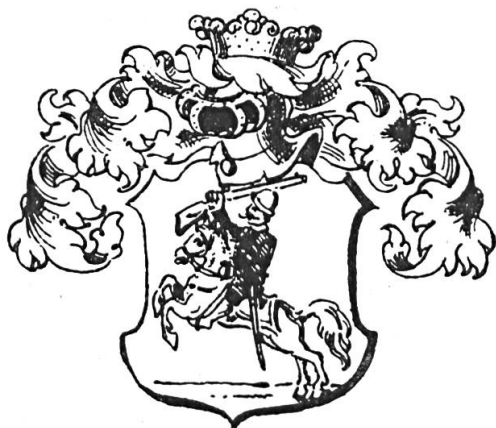
Fig. 2. Varga de Somkút, 1658

L'action de faire feu apparaît souvent dans le blason : le preux épaule son arme, il tire et fait mouche (fig. 3, 5). C'est le