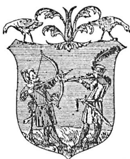
Fig. 6. Radák de Magyar-Bénye, 1514

cas, notamment, en ce qui concerne le premier blason hongrois dans lequel apparaît une arme à feu, en date du 18 janvier 1514 (fig. 6) 3 . En accord avec la coutume hongroise déjà analysée, sous d'autres rapports, un émule symbolique est parfois substitué au guerrier : un lion, un griffon ou une licorne, par exemple (fig. 7). Cela est presque toujours le cas lorsque le preux avait perdu la vie au cours de l'action récompensée dont le mérite revenait à ses héritiers, sous la forme d'un octroi d'ar-