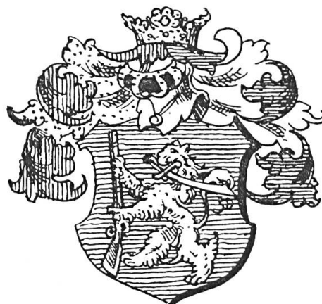
Fig. 7. Bágyoni de Kercesel, 1611

cas, notamment, en ce qui concerne le premier blason hongrois dans lequel apparaît une arme à feu, en date du 18 janvier 1514 (fig. 6) 3 . En accord avec la coutume hongroise déjà analysée, sous d'autres rapports, un émule symbolique est parfois substitué au guerrier : un lion, un griffon ou une licorne, par exemple (fig. 7). Cela est presque toujours le cas lorsque le preux avait perdu la vie au cours de l'action récompensée dont le mérite revenait à ses héritiers, sous la forme d'un octroi d'ar-