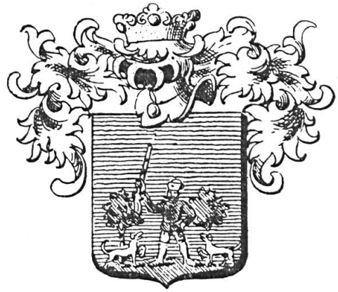
Fig. 10. Pusztai de Beczkó, 1658

de récompenses symboliques menant à une promotion sociale que celles du croisé brandissant un glaive, une hache ou une épée, au lieu de manipuler le détonateur d'un canon à culasse (fig. 12).