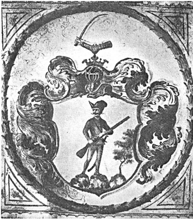
Fig. 9. Esze, 1708

à titre individuel ou collectif, leur propre image sur laquelle leur uniforme et l'arme qu'ils portaient étaient fidèlement reproduits, avec une minutieuse exactitude telle qu'elle peut faire la joie de tout hoplologue (fig. 9).