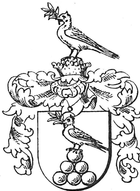
Fig. 13. Enyedi, 1697

Que ce symbole de la paix triomphante nous rassure. L'héraldique, qui suit l'homme à travers son activité la plus mortelle et la plus ancestrale — dans son rôle de homo dimicans — constitue, sans doute, l'un de ces archétypes dont la société conserve l'image depuis la nuit des temps. Elle ne les abandonnera donc jamais; que cette survivance se matérialise dans une forme proprement héraldique, ou dans une autre, elle répondra toujours à un besoin d'une manifestation imagée de certaines essences de l'existence humaine.