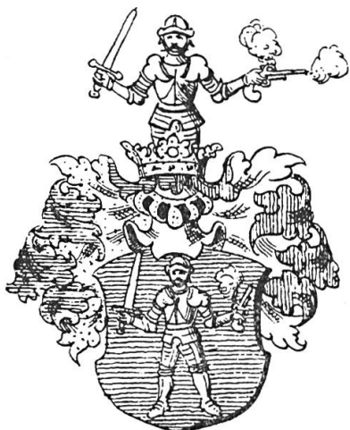
Fig. 5. Domokos de Bél-Megyer, 1625