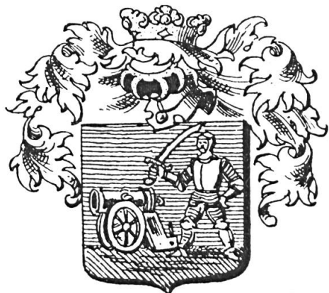
Fig. 12. Portörö de Várad, 1631