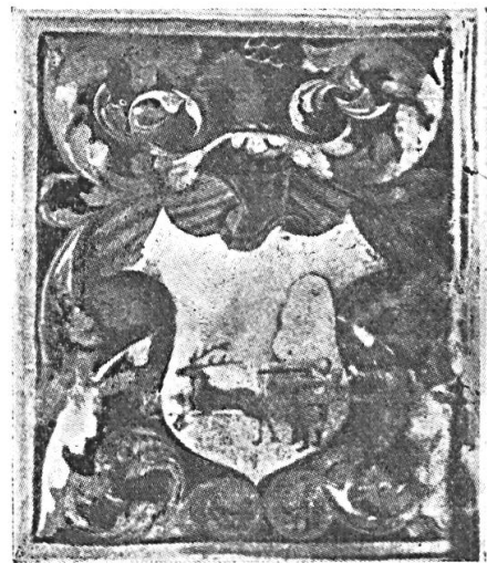
Fig. 11. Ányos de Nagy-Szántó, 1523

Pour terminer, signalons un cas curieusement unique, mais comportant aussi