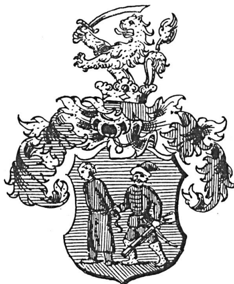
Fig. 8. Tshahien de Kálló, 1654

Lors des insurrections nationales des XVII e et XVIII e siècles, les volontaires d'une compagnie de carabiniers ou de fusiliers pouvaient recevoir comme blason,