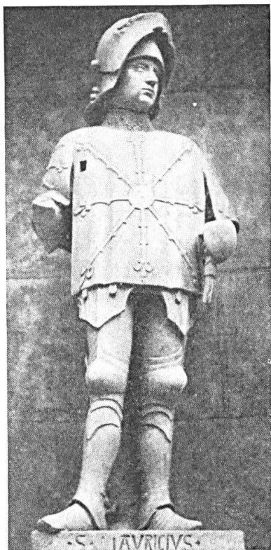
Fig. 4. Aix-en-Provence. Retable dit de la Tarasque, en raison du dragon de sainte Marguerite, qui y figure (1470). S'opposant à ce dernier, le rais d'escarboucle brille sur la cotte d'armes de saint Maurice. On remarquera les nœuds , sur le trajet des rayons. (Musée des monuments français, La sculpture, salle XVII) Guide éd. 1953, p. 39).

effet, qui éclaire parfaitement notre sujet : celle de « conservation de la force magico-vitale » (p. 146).