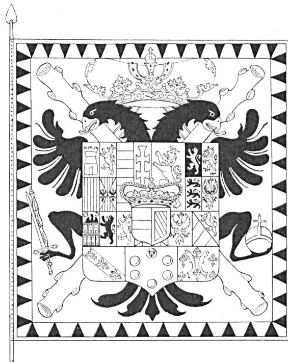
Fig. 2. Reconstitution du drapeau de Beaulieu (ex-Vierset)