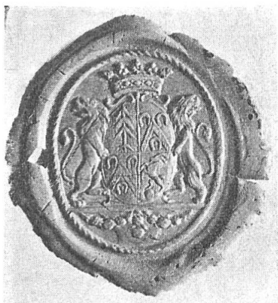
Fig. 1. Sceau Clebsattel, 1787.

de Bâle), est celui d'un des fils de François-Louis-Philippe de Clebsattel, bailli des ville et comté de Thann pour le compte des ducs Mazarin — office que les Clebsattel conserveront jusqu'à la Révolution — et de Claire-Barbe Menweg, vraisemblablement Aloys-François-Joseph de Clebsattel (1756-1824), avocat à Thann, puis juge de paix dans cette ville. Il se décrit : écartelé, au 1 d'or au sapin de sinople, aux 2 et 3 d'argent au chevron de sable accompagné de trois fers à cheval de même, deux en chef et un en pointe, au 4 de gueules au bouc saillant d'argent . Les armes des 2 e et 3 e quartiers sont celles de la grand-mère paternelle d'Aloys-François-Joseph, Marie-Sybille de Kesselring de Dornbourg (ou Thurnbourg), petit château sis à Wintzenheim (Haut-Rhin). A noter que ces fers à cheval étaient à l'origine des anses de chaudron (Kesselringe), comme l'écrit justement la Familiengeschichte der Reichsfreiherrn von Schauenburg Bühl, 1954, p. 199, qui se sont transformées en « cornières » dans l' Armorial général de 1696 , vol. 1, Alsace, Blasons, p. 295 (Sceau de Georg-Philippe Kesselring de Tournebourg, écuyer, capitaine au régiment de Montjoye), puis finalement en fers à cheval.