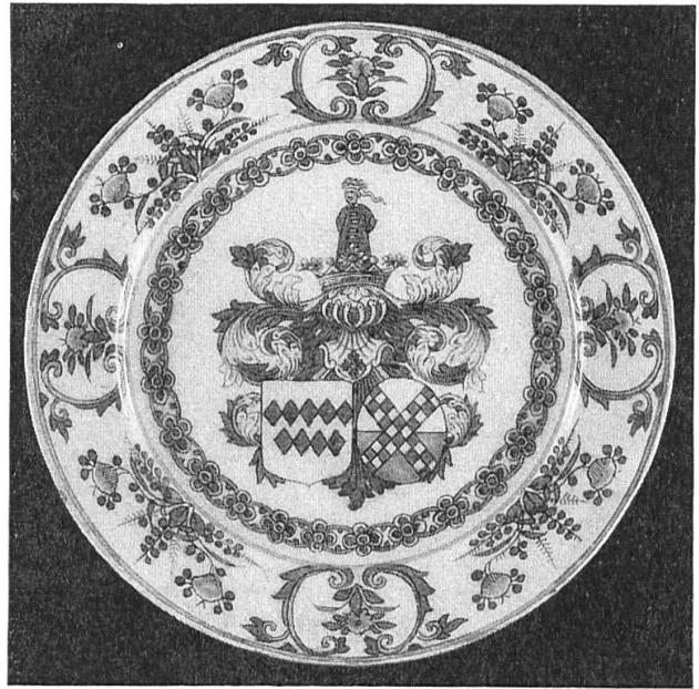
Fig. 1. Van der Does-van der Dussen, fin XVII e siècle.