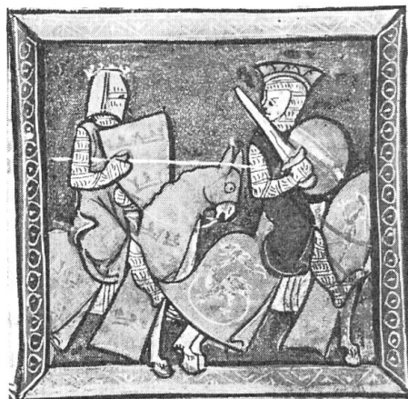
Fig. 4. Le roi Artus d'après le manuscrit de la bibliothèque nationale (XIII e siècle).

31 Clairambault, registre 28, pièce 2051. Cf. DEMAY : op. cit., n° 4973. Le texte de l'acte est le suivant : « Sachent tuit que je roy des heraus de Champagne ay eu et receu de Jehan Chauvel tresorier des guerres