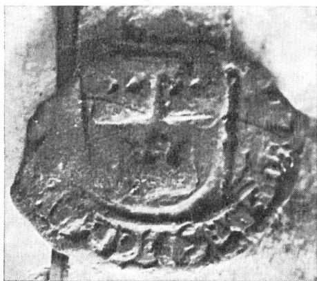
Fig. 2. Sceau de Boisrobert, roi des hérauts de France en 1318.

Moins d'un demi-siècle plus tard, le 18 novembre 1355, Guiot, roi des hérauts de Champagne, scellait à Hesdin une quittance de gages pour services de guerre sous le dauphin de Viennois. Son sceau 31 rond