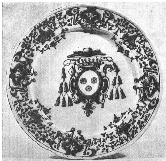
Fig. 1. Plat aux armes Rovero, d'Asti

Joseph Rovero, évêque d'Alba, 1697-1727, et plus tard, Jean-Baptiste Rovero, évêque d'Acqui, 1727-1744, avant d'être archevêque de Turin, 1744-1768, et cardinal, 1756; et