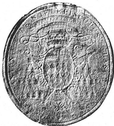
Fig. 2. Sceau de M.-A. de Noé, évêque de Lescar.

On retrouve les mêmes attributs sur son sceau de Lescar en 1780 3 mais la croix au-dessous de l'écu est surmontée d'une couronne de comte. C'est le type de celles concédées aux chapitres nobles de France au cours de la seconde moitié du XVIII e siècle (fig. 2).