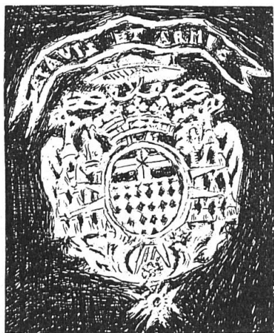
Fig. 1. Fer de reliure de M.-A. de Noé, évêque de Lescar.

doit vouloir représenter celle du chapitre noble de Lescar (fig. 1).