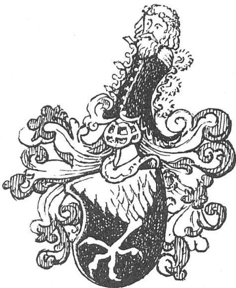
Fig. 1. de Staal (Soleure).

Si la famille soleuroise de Staal, dont les armes de sable à une patte de griffon d'or (fig. 1)