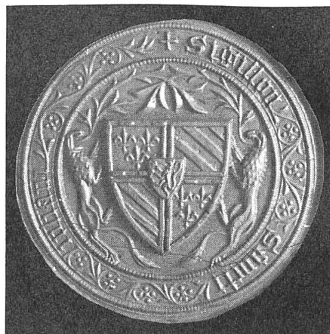
Fig. 3: Sceau de Saint-Julien. Epreuve d'une matrice conservée à la Bibliothèque nationale.

Dans la mesure où il est possible d'émettre un avis sur une pièce de ce genre sans l'avoir eue entre les mains, la matrice du sceau de la cour du comté de Charolais dont a été tirée l'empreinte reproduite ici, semble bien authentique, les détails du fragment de sceau de 1426 encore appendus à un acte conservé en Bourgogne