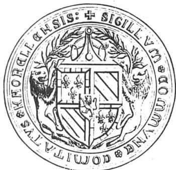
Fig. 1: Sceau de la cour du comté de Charolais. Gravure insérée dans la Description... du duché de Bourgogne de Courtépée.

Le sceau de la cour du comté de Charolais avait un diamètre de 52 mm, c'est-à-dire qu'il était notablement plus grand que ceux habituellement utilisés par les juridictions ducales.