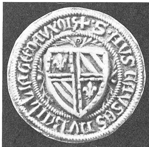
Fig. 5: Sceau du bailliage d'Auxois provenant de la collection Chappée et conservé à la Bibliothèque nationale. (cl. J.-B. V.).

Cette matrice est également fort suspecte. Si la présence d'une seule fleur de lis