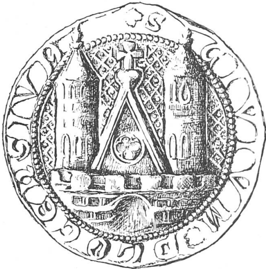
Fig. 1. Premier sceau de la ville de Plock, 1314.

L'auteur étudie l'histoire et l'évolution des armoiries de Plock en Pologne, une des plus anciennes villes de la Mazovie, et de celles de la voïvodie du même nom. Il base son travail sur les sceaux successifs utilisés, papiers administratifs et objets divers. Le premier sceau, utilisé dès 1314, représente la façade de la cathédrale de Plock, sommée d'une croix, accostée de ses deux tours, issant d'une muraille crénelée ouverte d'une porte (fig. 1). Cette composition