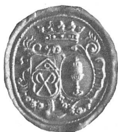
Fig. 1. Sceau à identifier.

Cette élégante et curieuse composition héraldique de la seconde moitié du XVIII e siècle mérite d'être publiée (fig. 1). Deux écus placés côte à côte dans un cartouche baroque, sont timbrés d'une couronne à cinq fleurons. Le premier écu de forme classique à base arrondie, légèrement recouvert par son voisin de senestre ovale, porte des emblèmes dont le sens est à préciser. Un tablier (?) chargé de deux sabres passés en sautoir est surmonté d'un triangle. Le second écu porte une coupe fermée d'un couvercle sur champ d'azur.