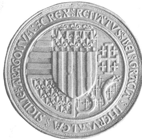
Fig. 2. Empreinte d'une notice de sceau aux armes de René d'Anjou après 1466. Cette forgerie présente l'avantage de constituer une figure plus nette que le sceau utilisé de 1466 à 1480 dont les épreuves sont de qualité médiocre (cl. J. B. V.).

mise en forme des matériaux rassemblés il y a plus de dix ans. Cet article n'a donc d'autre but que de compléter la documentation qui doit être publiée au cours des prochaines années dans un ouvrage sur René par M. de Merindol et dont la parution est vivement souhaitée.