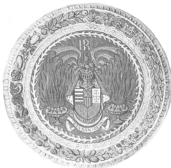
Fig. 4. Dessin de la collection Gaignières représentant une pièce de faïence très proche de celles de Fiesole et d'Aix. Ce dessin est celui de la collection Clairambault.

rimée. C'est notamment le cas d'une céramique 11 aujourd'hui au Victoria and Albert Museum de Londres qui ornait autrefois près de Fiesole l'une des demeures des Pazzi, famille dont les liens avec René ont été démontrés par mon ami Otto Pächt 12 . Au centre de cette pièce ronde, de 3,35 m se trouve un écu aux armes de René telles que portées après 1466. L'écu est timbré d'un heaume couronné sommé d'une fleur de lis à quatre fleurons lesquels sont surmontés de quatre houppes rouges («ung lis a quard florans sur lesquels sont assis quatre vermeils touffans»). La fleur de lis est enserrée entre des ailes de dragon 13 d'or et de gueules aux bouts acérés («alles de dragon... d'or et de gueules pointues de toutes pars») qui sont en réalité le très ancien cimier des comtes de Barcelone 13 . L'écu est placé sur un manteau aux armes d'Anjou et au revers d'hermines assujetti à la couronne du heaume comme une capeline. Sous l'écu, le croissant avec la devise de l'ordre de René LOS EN CROISSANT. Cette composition, sommée des lettres R.I., est accostée de deux chaufferettes d'or du sommet desquelles s'échappent des flammes tandis qu'un phylactère passé dans les poignées intérieures des chaufferettes porte l'inscription «Dardant désir» («chaufferet porte dardant