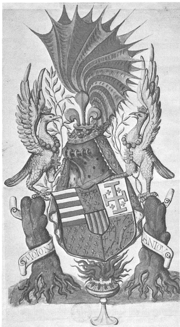
Fig. 6. Grandes armes de René d'Anjou après 1466. Dessin de la collection Clairambault 1309, f° 2. Le cimier arboré par René après 1466 est celui des rois d'Aragon qui vient lui-même des comtes de Barcelone.