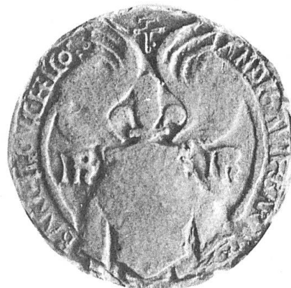
Fig. 3. Contre-sceau de René d'Anjou après 1466.

Il est cependant d'autres objets où se voient les éléments parahéraldiques de la description