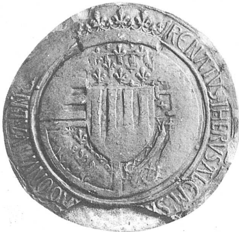
Fig. 1. Sceau de René d'Anjou appendu à un acte de 1480 et portant les armoiries arborées de 1466 à 1480.