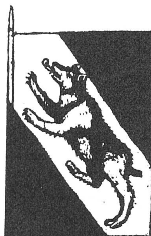
Abb. 2. Ein gänzlich missratener Bär, der wie ein Hund aussieht: Schlanke Beine, Pfoten statt Tatzen, schlanker Kopf mit spitzen Ohren, Schwanz. Titelbild der Laupenschlachtillustrationen aus Diebold Schillings Berner Chronik von 1485.