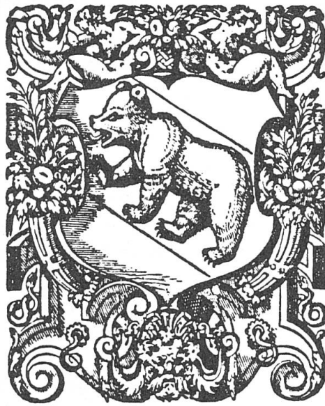
Abb. 7. Ein hübscher Wappenbär aus der Barockzeit. Der grosse rundliche Kopf gehört allerdings zu einem Jungtier. Drucker- marke der Buchdrucker Le Preux in Lausanne, 1571.

Der geneigte Leser mag sich nun fragen, ob es überhaupt Bernerwappen und -fahnen mit einigermaßen korrekten Bären gibt oder ob die vorgebrachte Kritik insofern ins Leere stösst, als fast alle Bären- darstellungen auch bei der gebotenen Toleranz als nicht korrekt zu bezeichnen sind und es also eigentlich gleichgültig ist, ob sie in der einen oder in der anderen Hinsicht nicht zu befriedigen vermögen.