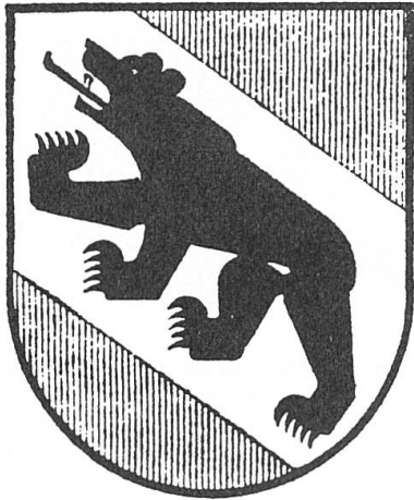
Abb. 4. Moderner, langbeiniger Wappenbär (Kamtschatkatyp) mit windhundartig eingezogenem Bauch.