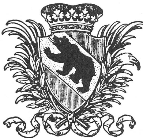
Abb. 1. Ein schön proportionierter, zoologisch korrekter Wappenbär des Kunstmalers und Heraldikers Rudolf Münger (1862–1929).

Wir wissen natürlich, dass man den Heraldikern und mehr noch den Grafikern eine grosse Gestaltungsfreiheit ein-