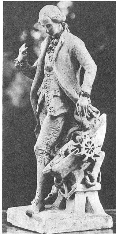
Fig. 3. Maquette de la statue de C.F.D. de Jouffroy d'Abbans, l'inventeur de la navigation à vapeur, élevée à Besançon, place de la Madeleine, détruite par les Allemands en 1943.

IX. Claude-Jean-Eugène , marquis de Jouffroy d'Abbans, 1715-1796. Chevalier de Saint-Louis et de Saint-Georges, il était en 1788 le doyen d'âge des gentilshommes de la province. Pendant la Terreur, son état de santé lui évita la prison. Il avait épousé Jeanne-Henriette de Pons de Rennepont, qui lui donna trois filles et deux fils, dont l'aîné fut Claude-François-Dorothé (1751-1832), l'inventeur du bateau à vapeur (fig. 3). Le second,