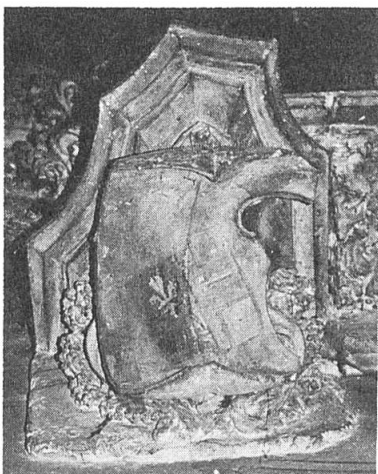
Abb. 2. Wappen auf der linken Konsole, Frankreich-Savoyen.