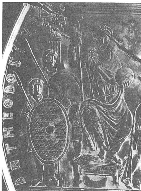
Fig. 1. Patera hispano-romaine, IV e siècle.

Dans l'époque médiévale, le «trianglé» a été utilisé sur les habits, probablement confectionnés en fourrures. Les triangles sont alors rangés de sorte que le sommet de l'un est au centre de la base de celui situé au-dessus. Les triangles sombres, généralement d'un ton bistre, ont toujours leur sommet vers le haut. La ressemblance de cet ornement avec le vair est évident. Des tuniques ainsi façonnées sont portées par la pedisequa d'une reine de Léon du X e siècle représentée en 1125-1127 sur le Liber Testamentorum de la Cathédrale d'Oviedo