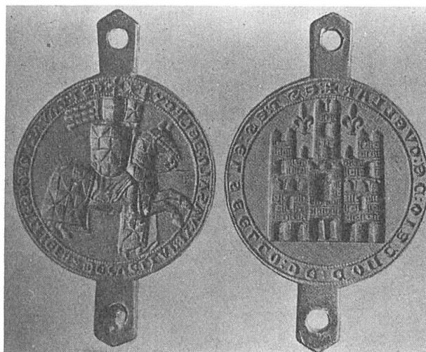
Fig. 5. Sceau de l' alférez de la ville de Cuéllar (Ségovie), fin XIII e siècle.

Le dernier type du «trianglé» est une variante du précédent, les points de l'échiqueté étant alternativement tranchés et taillés, ce qui produit un curieux effet de gironnés enchaînés. Nous trouvons ce type dans les armoiries portées par l' alférez (porte enseigne) de la ville de Cuéllar (Ségovie) vers la fin du XIII e siècle d'après la matrice de son sceau (fig. 5) 6 . Le même dessin héraldique apparaît sur un remarquable coussin trouvé dans le tombeau de Fernando de la Cerda, fils aîné d'Alphonse X de Castille, donc un peu antérieur à 1275. Il est brodé de carreaux sur lesquels des rois nous montrent leurs manteaux doublés de vair et leurs tuniques avec des ornements héraldiques: chevronné, losangé, échiqueté, bandé, barré, vairé