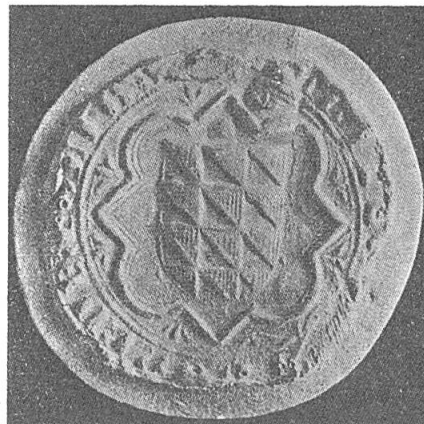
Fig. 4. Sceau d'Athón de Foces, 1296, Aragon.

glé» d'or et de gueules est représenté sur une peinture murale de la fin du XIII e siècle trouvée à Barcelone, rue Durán i Bas (fig. 3), dont l'attribution reste inconnue. Ces mêmes armoiries, mais d'argent et de gueules, apparaissent au commencement du XVI e siècle dans le Libro de Armería de Navarre, sous l'entrée d'un inconnu palacio de Larraça . On relève encore une fois le trianglé de ces émaux dans l'héraldique navarraise sur les armoiries du palacio de Guenduláin : d'or, à la croix émanchée de gueules et d'argent 2 . Le losangé d'or ou argent et de gueules existe en Catalogne (Centelles, etc.) et en Navarre (Tardets), si bien que le «trianglé» de ces mêmes émaux pourrait être une dérivation ou brisure, selon l'hypothèse avancée par Riquer 3 .