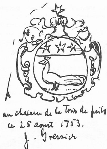
Fig. 4. Cachet de 1753 relevé par D. L. Galbreath.

cachet de 1753: d'argent au paon passant, au chef d'azur chargé de trois étoiles. Et pour cimier, une fleur de lys. Mais la figure qui accompagne cette notice montre un paon rouant. Le cachet mentionné est resté introuvable 8 , mais nous en possédons un croquis de la main de l'auteur (fig. 4) 2 , qui montre bien le paon passant; le cimier en est une étoile et non une fleur de lys.