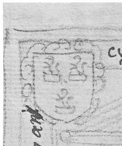
Fig. 3. Détail du dessin de la tombe d'Autun (cl. J.B.V.).

Les angles de la dalle étaient ornés d'écussons :