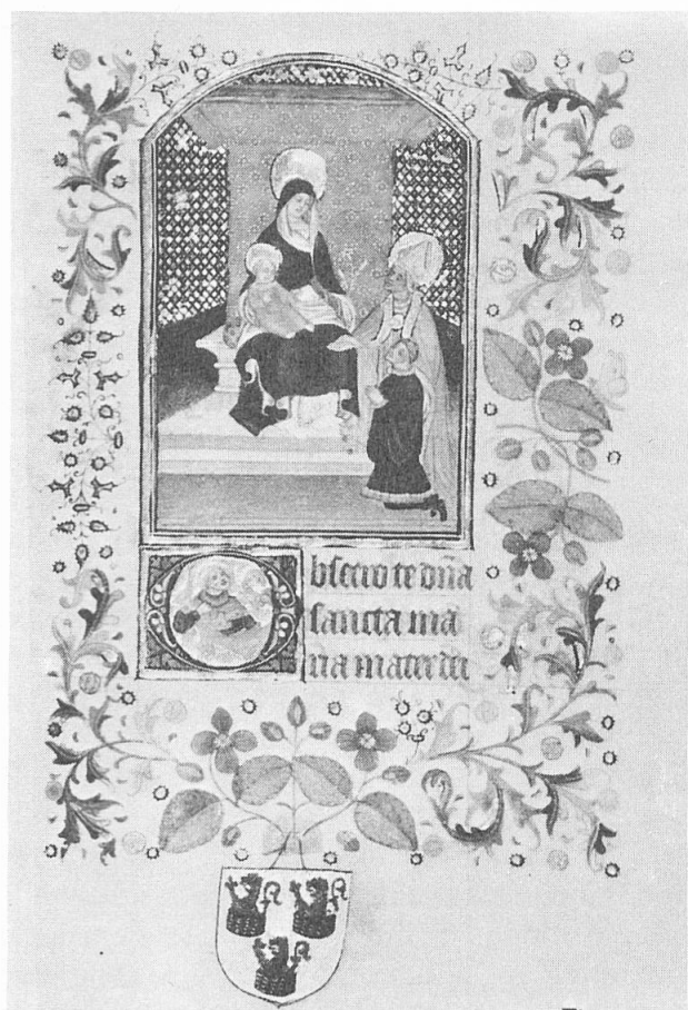
Fig. 1. Le folio 234 Ms. W. 219 de Baltimore.

heures du duc de Berry paraissant lui être dues 6 .