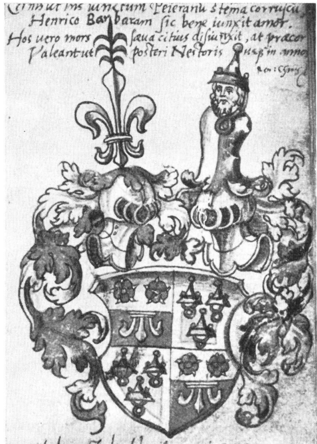
Fig. 4. Wappen des Zürcher Bürgermeisters Heinrich Göldlin und seiner Gemahlin Barbara Peyer.

schwarz, Sehne und Pfeilschaft golden. Aus einem Stechhelm wächst der pfeilschiessende Knabe. Decken : Blau-weiss. Blatt 18.