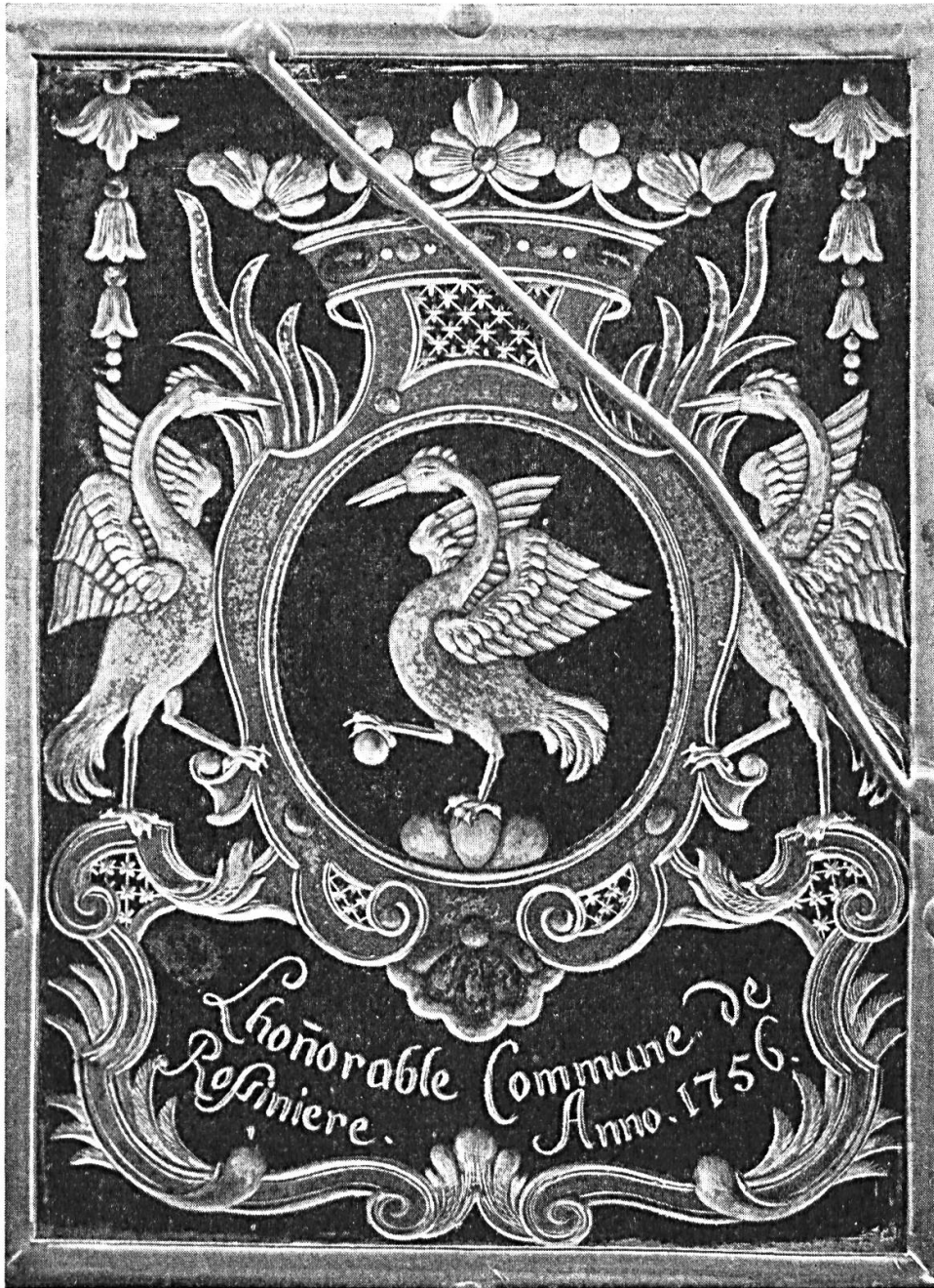
Fig. 2 Vitrail de la commune de Rossinière, 1756.

Rossinière. L'étoile a disparu, le cartouche armorié est tenu par deux grues (fig. 2) 2 . Le même emblème décore un sceau communal du XVII e siècle (fig. 1) 3 .