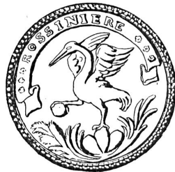
Fig. 1. Sceau communal de Rossinière, utilisé au XVIII e siècle.

mont de sinople, accompagnée à dextre d'une étoile d'or. Les tenants, deux hommes d'armes, appuyés l'un sur une pique, l'autre sur une hallebarde, rappellent la garde traditionnelle du passage de la Tine par les habitants de Rossinière (pl 1). L'étoile d'or est une brisure des Gruyères, seigneurs de Montsalvens dont Rossinière a relevé.