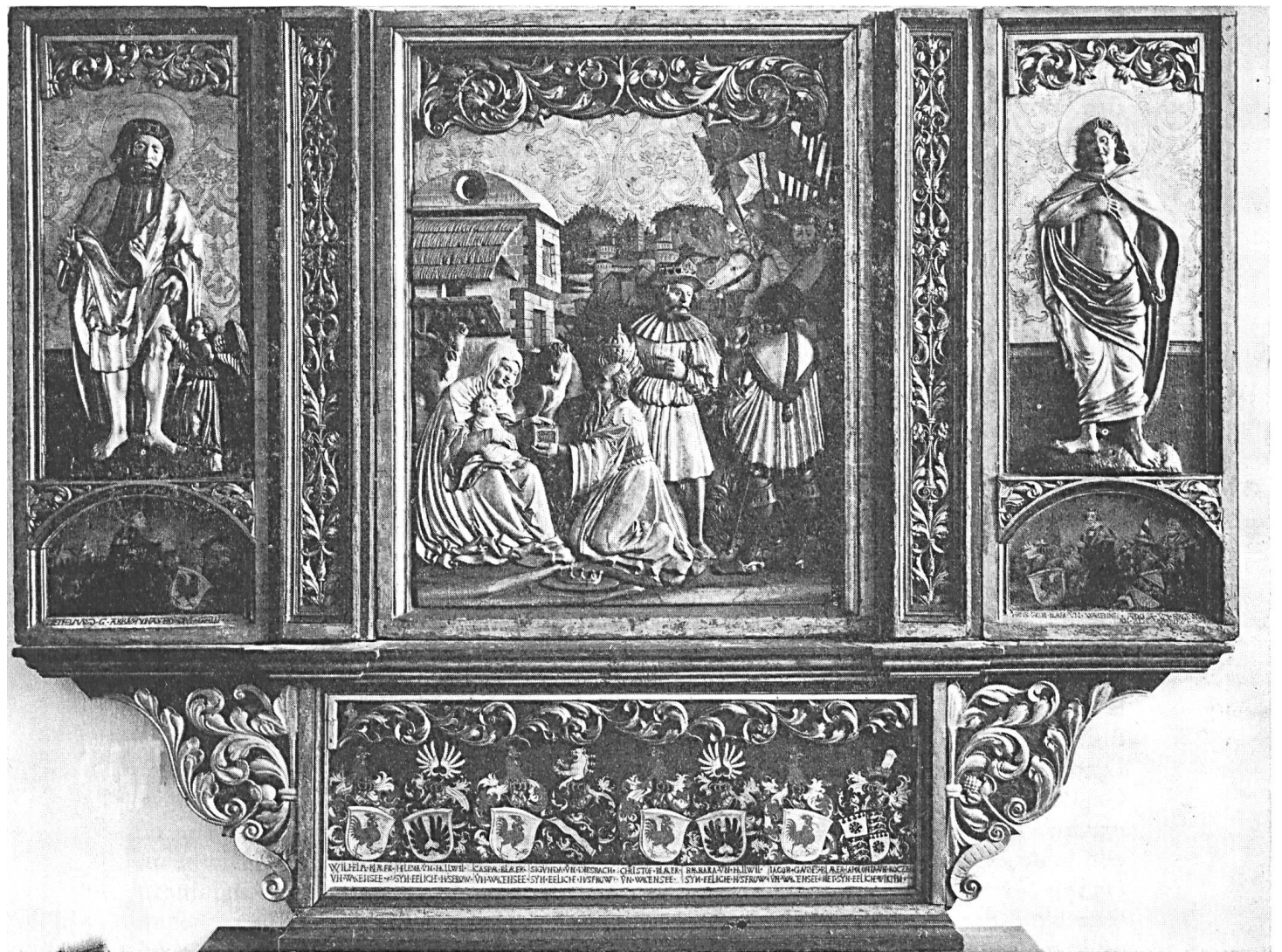
Pl. 1. Retable du château de Wartensee.