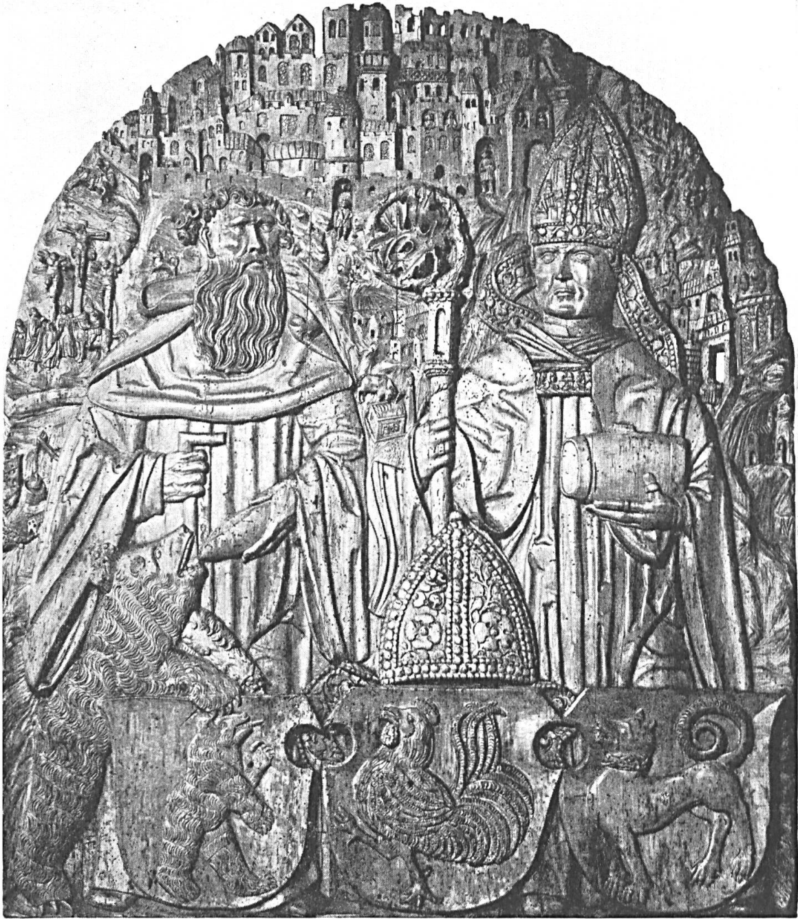
Fig. 3. Relief de 1535 aux armes de l'abbaye de Saint-Gall, de l'abbé Blarer et du comté de Toggenbourg.