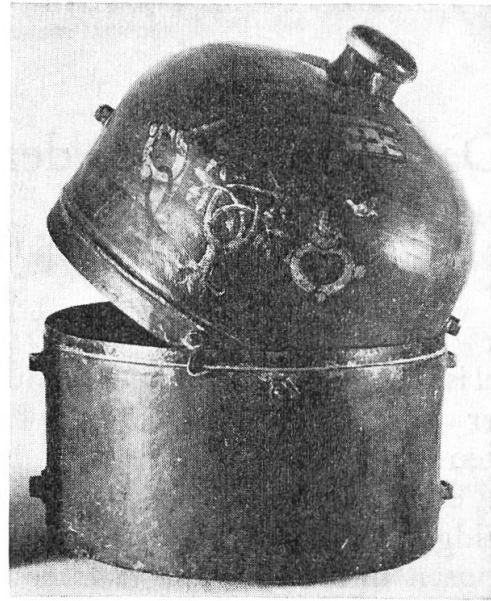
Abb. 3. Hutbüchse mit dem Wappen des Papstes Julius II. (Della Rovere).

dem Familienwappen des Papstes geschmückte Banner sowie ein geweihtes Schwert nebst Hut und den Ehrentitel 7 «Beschützer der Freiheit der Kirche». Kardinal Schiner, Mittler zwischen der Eidgenossenschaft und dem Hl. Stuhle, veranlasste, dass auch die einzelnen Orte seidene Banner — im ganzen mehr als 30 Stück — mit ihren Wappen bekamen, die aber als Auszeichnung Bilder aus der christlichen Geschichte als Beigabe tragen. So kam auch Mülhausen zu seinem Banner.