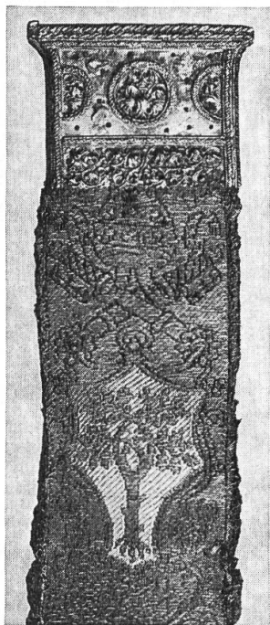
Abb. 2. Gürtel mit Wappen des Papstes Julius II. (Della Rovere).

Als Anerkennung des Papstes erhielten die Eidgenossen am 5. Juli in Verona zwei mit dem Wappen des Hl. Stuhles und