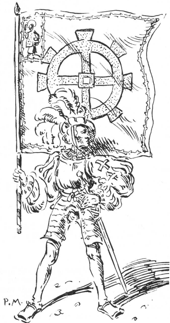
Juliusbanner vü Mülhausen / Els. ~ MCXII ~

Nach Neubecker 12 ist Gold im Mittelalter die Auszeichnungsfarbe der Ritter gewesen, sei es mit den Sporen, deren Anlegung einen Ritter zum «Miles auratus» werden liess, sei es in den Abzeichen der Ritterbünde, in denen die Knappen das Abzeichen silbern, die Ritter golden trugen. In diesem Sinne ist auch die Wortwendung im Text des Kardinals Schiner zu verstehen : «in aureum et militare colorem commutare». In etwas anderen Worten steht in der päpstlichen Bulle : «in aureum ac militare colorem convertere».