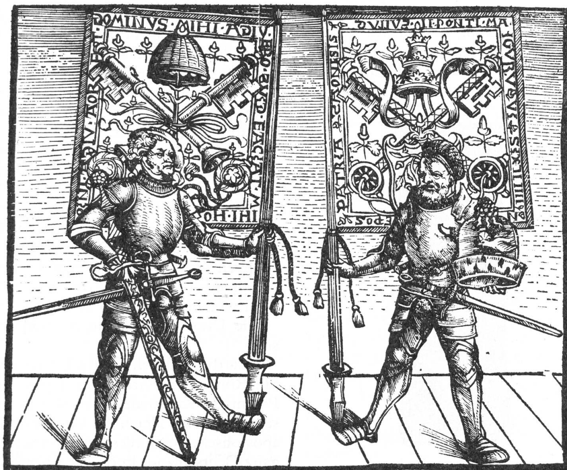
Abb. 1. Banner, Schwert und Hut, an die Eidgenossen von Papst Julius II. geschenkt.

Im Jahre 1506 bemühten sich die Mülhauser, mit Basel einen Allianzvertrag abzuschliessen mit dem Gedanken, dadurch später zu einem Bündnis mit der Eidgenossenschaft zu kommen. Dieser Vertrag kam auch tatsächlich zustande und