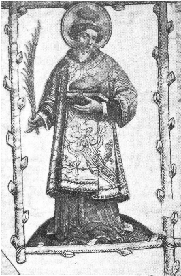
Abb. 5. Eckstück mit dem Hl. Stephan.

Palmwedel und in seiner Linken ein geschlossenes schwarzes Buch, auf dem ein blauer Stein liegt. St. Stephan trägt ein blaues damasziertes Untergewand und ein goldfarbenes, ebenfalls in Rot damasziertes Messkleid sowie ein goldenes Käppchen mit einem blauen Stein. Die Aureole ist golden gehalten. Die aufgemalte Figur steht im gelblichen, einst weissen Fahnen-tuche. Das Eckbild ist sehr wahrscheinlich auf beiden Seiten des Banners angebracht und ist nach oberitalienischer Manier gemalt worden.