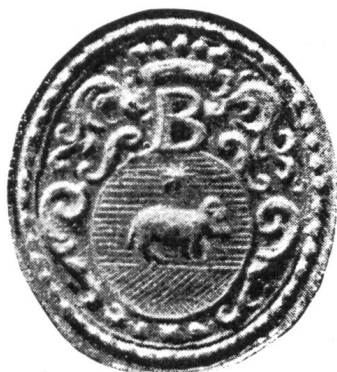
Fig. 4. Sceau communal, 1766.

Un autre blason différent, également parlant, apparaît sur un sceau apposé en 1766, mais peut-être gravé plus tôt 1 : d'azur au bélier contourné (d'argent), passant sur une terrasse de sinople, accompagné en chef d'une étoile à huit rais (d'or) . Le B couronné n'est pas abandonné, il surmonte l'écu ovale (fig. 4). Un timbre humide et un