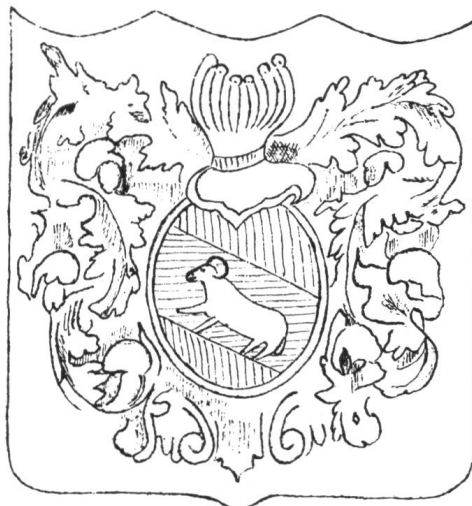
Fig. 7. Channes de communion, 1773.

Deux channes de communion de 1773 (Paroisse réformée) sont décorées d'une composition héraldique maladroite à l'écu de gueules, à la bande d'azur chargée d'un délier passant de sable (fig. 7). Il s'agit de toute évidence d'une adaptation locale des armes de la République de Berne,