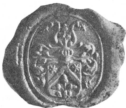
Fig. 8. Jean-Georges Wicka, chanoine de Moutier-Grandval, sceau, 1730.

La branche cadette de la famille, artisanale jusqu'à la fin du XVIII e siècle, n'a pas respecté le verdict du Conseil de Delémont de 1714. Bien que ne descendant pas de Jean-Girardin Wicka, bénéficiaire de la concession de 1584, elle porte le blason de la branche aînée. Ainsi en use le tailleur Joseph-Ignace (1722-1786) sur son cachet ovale de 1774 entouré de deux palmes (fig. 9) 5 , puis ses deux fils dont les sceaux sont conformes à l'ex-libris de Jean-Jacques-Conrad (voir fig. 7). Le premier, Henri-Joseph (1753-1837), fit une belle carrière de magistrat : avocat aulique, procureur fiscal, syndic du Chapitre de