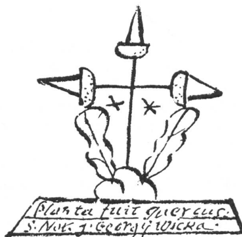
Fig. 2. Seing du notaire Gérie Wicka, 1596.

bas d'un acte du 14 décembre 1596. Trois glands mis en croix, accompagnés de deux étoiles et de deux feuilles de chêne, sont fichés sur un mont de trois coupeaux. Ce dernier est posé sur un listel à l'inscription : Planta fuit quercus. S. Not. J. Georgy Wicka (fig. 2) 1 .