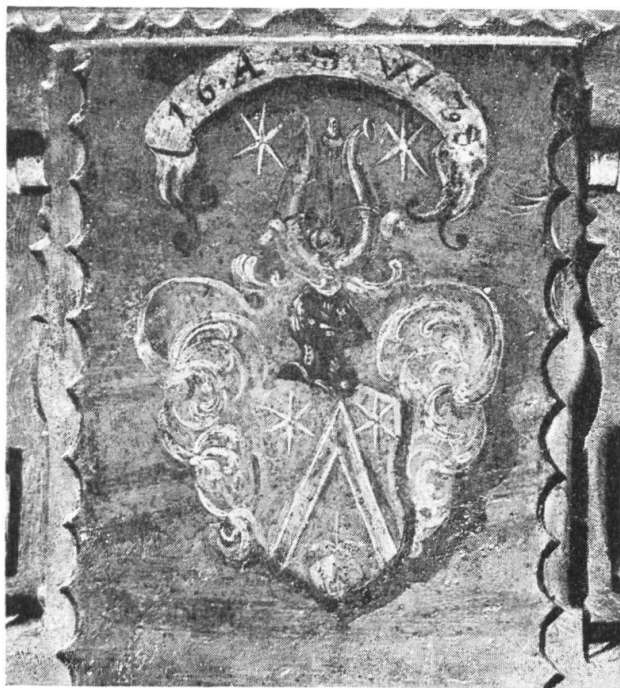
Fig. 6. Armoiries de Anne-Salomé Wicka sur son coffret de mariage, 1678. Bibliothèque des Jésuites, Porrentruy.

Casque contourné fermé, sommé de deux proboscides, l'un de gueules, l'autre d'or, accompagnés en chef de deux étoiles d'or,