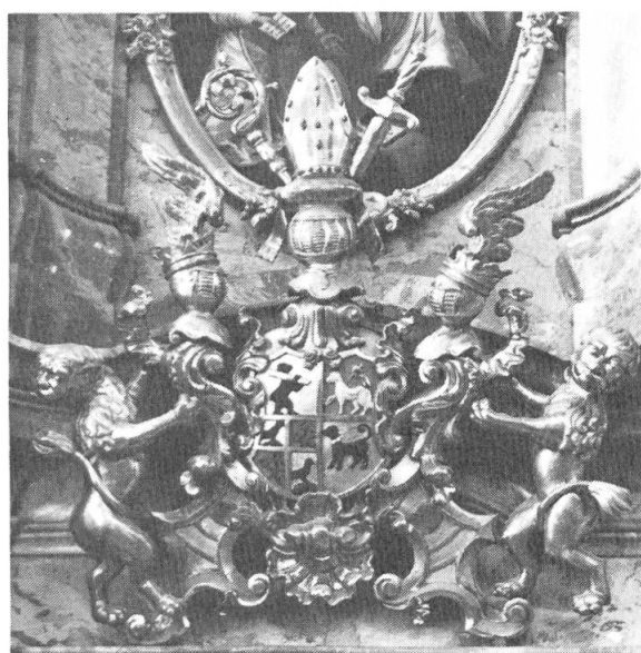
Abb. 4. St. Gallen.

Die von zwei Putten gehaltene Stifterkartusche der Bendeiktinerabtei Muri schmückt den St. Anna-Altar (äusserer Altar links). Das gevierte Vollwappen von Fürstabt Gerold Haimb hat in Feld 1 in Gold den roten Löwen des Stifterhauses Habsburg; in Feld 2 in Blau einen goldenen Sporn, das Wappen Haimb; in Feld 3 den österreichischen Bindenschild (die silberne Binde etwas plump «damasziert»); in Feld 4 in Gold ein silberner steigender Löwe, vermutlich das Wappen der Mutter des Abtes (Barbara Thienger aus Stühlingen im Schwarzwald) 3 . Als Herzschild erscheint das Stiftswappen: in Rot die silberne Mauer mit drei Zinnen. Das Oberwappen entspricht demjenigen von Fürstabt Nikolaus II. von Einsiedeln, zeigt jedoch die für Muri bezeichnende Variante, dass dem bekrönten Spangenhelm rechts der habsburgische Löwe entsteigt, der jedoch nicht rot, sondern in Gold gefasst ist (Abb. 3).