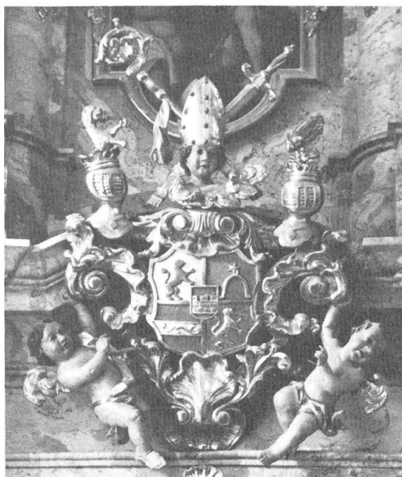
Abb. 3. Muri.

ten je 500 Gl. womit auch die Kosten für die zwei restlichen Altäre mehr als gedeckt waren.