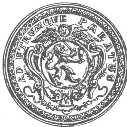
Abb. 1. Siegel des Hochstifts Engelberg, das nur für die Reichsbotschaften an den Unüberwindlichen Grossen Rat verwendet wird.

sehenen Ratsherren gehört, die hier ihre eigenen gravitätischen Amtsgewohnheiten munter zu persiflieren pflegten. Auch die würdigen Benediktiner von Engelberg machen den Ulk seit dem Anfang des 17. Jahrhunderts ohne duckmäuserische Vorbehalte fröhlich mit und haben sich sogar für ihre alljährliche Korrespondenz mit dem Rat ein eigenes Siegel geschaffen, das einen schreitenden Löwen mit Schwert und Humpen und der Umschrift «Ad utrumque paratus» zeigt: «Zu beidem bereit», zu Kampf und Trunk (Abb. 1).