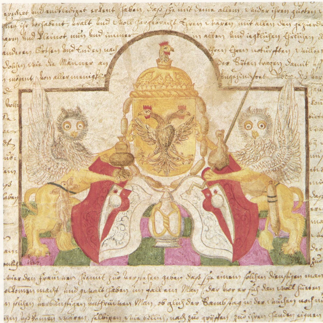
Abb. 4. Weiberwappen im Weiberbrief von 1627. Originalgröße 134 mm breit, 106 mm hoch. Erstmalige farbige Wiedergabe mit freundlicher Erlaubnis des Reichskongresses vom 14. Februar 1980.