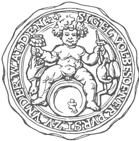
Abb. 2. Siegel des Unüberwindlichen Grossen Rates von Stans aus dem Jahre 1597.

Schmutzigen Donnerstag mit dem gemeinsamen Kirchgang einleitet und für jeden ihrer verstorbenen Angehörigen eine Seelenmesse feiern lässt. Das aber hindert den Rat nicht, auf seinem Siegel von 1597 1 einen nackten, über einem Weinfass thronenden Bacchus zu führen (Abb. 2). Frömmigkeit und derber