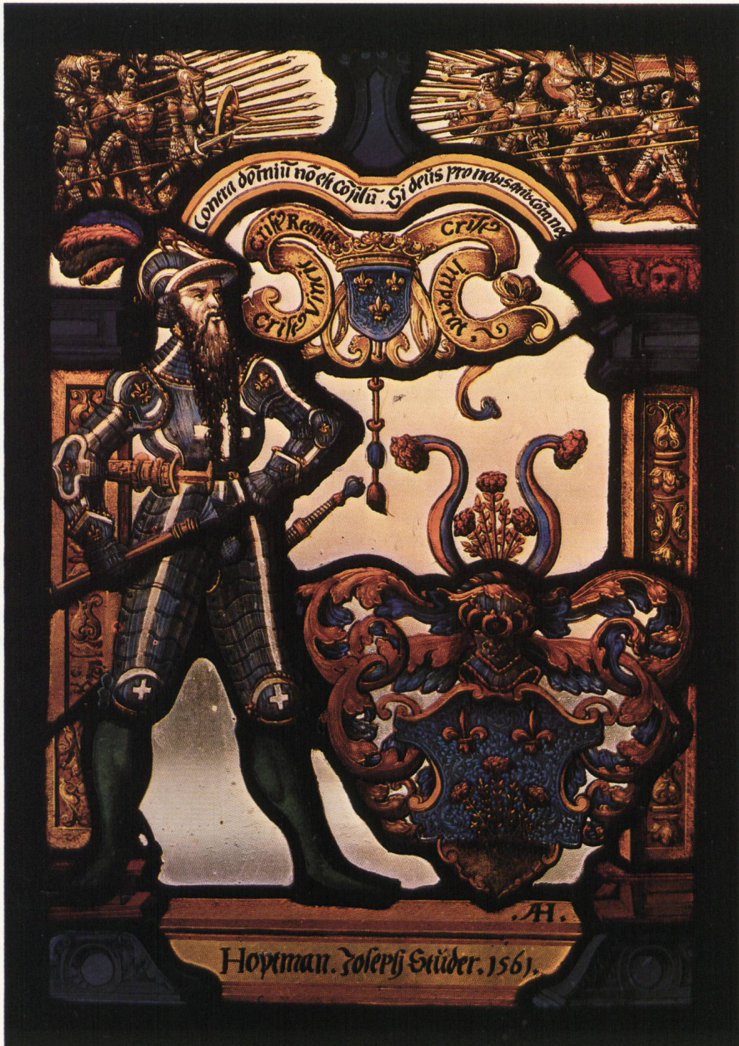
Abb. 2. Hauptmann Joseph Studer, 1561.