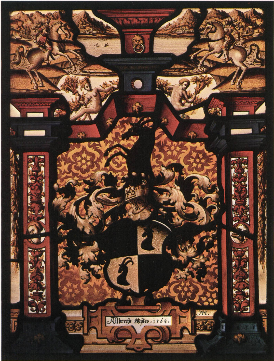
Abb. 3. Albrecht Miles, 1562.