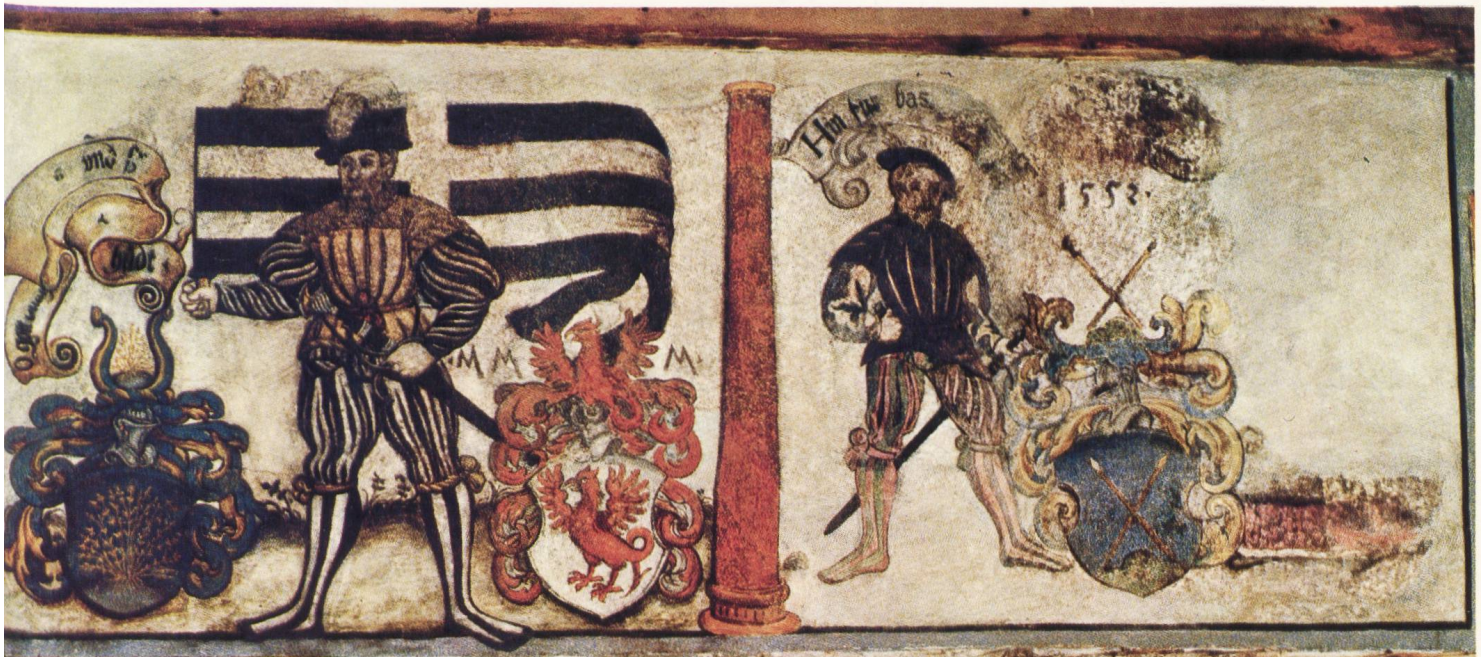
Abb. 6. Wandmalerei von Andreas Hör im Hause Hinterlauben 13, St. Gallen. Rechte Seite mit den Stifterwappen Studer, Mangolt und Rainsberg.

Neben dem geharnischten Ritter links des Mötteli-Wappens, ist auch die Familie Krom vertreten, denn die leicht bekleidete Frau mit goldener Halskette sitzt auf einem schwarzen, nach hinten gewendeten Igel, dem Tier des Schildbildes der sanktgaller Familie Krom.