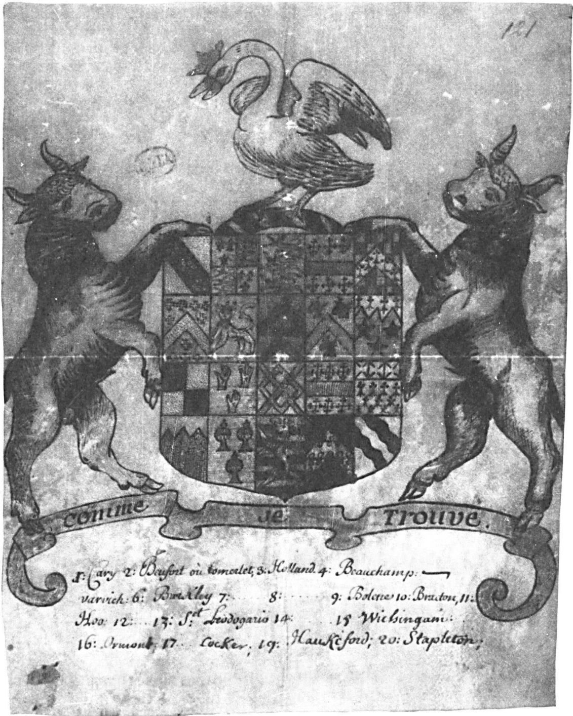
Pl. I. Armoiries d'Ann Carey et de ses ascendants copiées en 1710. Quartiers: 1, Carey; 2, Beaufort-Somerset; 3, Holland; 4, Beauchamp-Warwick; 5, Newburgh; 6, Berkeley; 7, L'Isle; 8, L'Isle; 9, Boleyn; 10, Bracton; 11, Hoo; 12, Malmaynes; 13, St Léger; 14, St Omer; 15, Wychingham; 16, Ormond; 17, Butler; 18, Cocker; 19, Hanckford; 20, Stapledon.