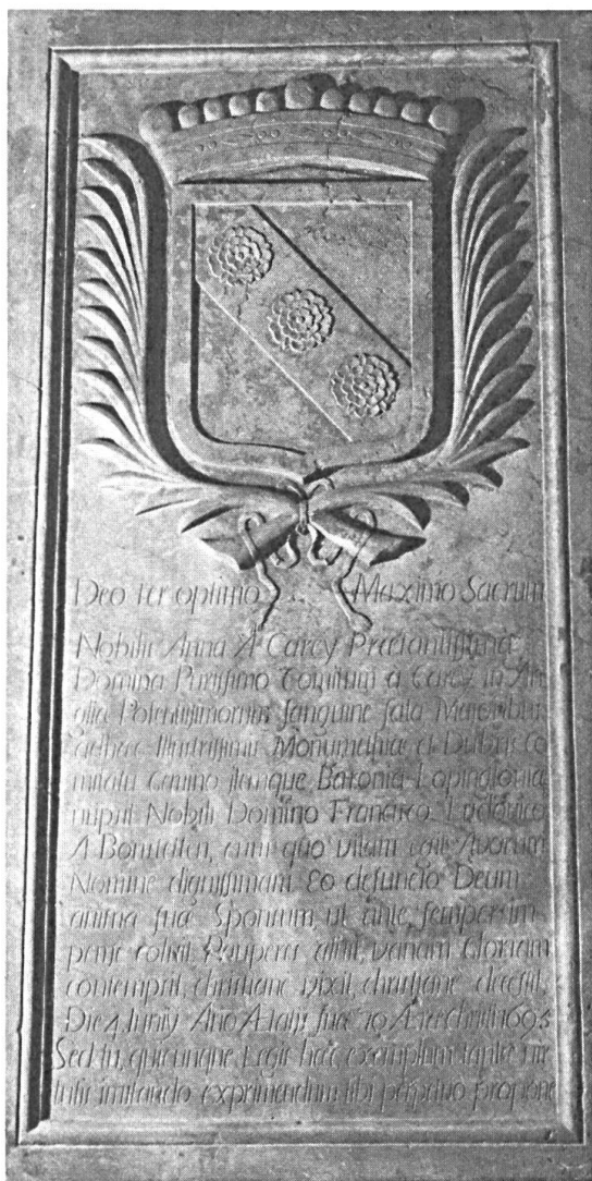
Fig. 1. Pierre tombale d'Ann Carey, veuve de François-Louis de Bonstetten, 1695. Eglise de Travers, NE.