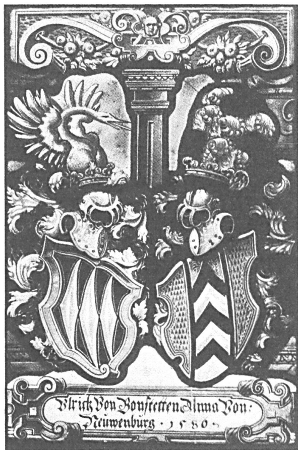
Fig. 3. Vitrail aux armes d'Ulrich de Bonstetten et d'Anne de Neuchâtel, 1586. Collection de Mulinen, Musée National, Zurich.

stetten ? Ulrich, fils de Jean-Jacques de Bonstetten, de Berne, gouverneur du comté de Neuchâtel, s'allie en 1577 à Anne, fille de Jean de Neuchâtel, seigneur de Vaumarcus et Travers (fig. 3) 12 . Le père de la mariée descendait d'une branche illégitime des comtes de Neuchâtel à laquelle avaient été inféodés Vaumarcus en 1376 et Travers en 1413. Les Bonstetten